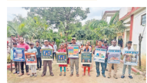
రామాయంపేట: నషా ముక్తి భారత్ కరప్రతాలను ఆవిష్కరిస్తున్న బాలల పరిరక్షణ సిబ్బంది

మత్తుపదార్వాలతో విద్యార్ధుల బతుకులు చిత్తవుతున్నాయని, యువత బంగారు భవిష్యత్ను నాశనం చేసుకుంటోందని పలువురు పోలీస్ စာဆုနာလည်း စဝည်းလျှင်း (ၾဂြံ့ ညီထာဝမြဲအ ဆာတီမျှဆာတို့ భာဂဝက ဆဝဂုန်ဆာဝဝ పိုယ် ဆုံဝန်ခုပည်, မနာနာမတို့ ဆိုတာ့လွှဲပြော ဆမာ့ పదార్హాల వినియోగంతో కలిగే దుష్పరిణామాలను విద్యార్థులకు వివరించారు. విద్యార్థిని విద్యార్థులు సెల్ఫోన్లకు దూరంగా ఉండాలని చదువుపై శ్రద్ధవహించాలని సూచించారు. ఈ సందర్భంగా విద్యార్థులకు వ్యాసరచన పోటీలు నిర్వహించారు. విద్యార్థినులు ఆపద సమయంలో డయల్ 100 కాల్ చేయాలని, ఆకతాయిల ఆగడాలను అరికట్టేందుకు షీటీంలు అందుబాటులో ఉన్నాయన్నారు. విద్యార్థినులు ఈ అవకాశాన్ని సద్వినియోగం చేసుకోవాలన్నారు. డ్రగ్స్ నియంత్రణకు ప్రతిఒక్కరూ కృషిచేయాలని, గుర్తు తెలియని వ్యక్తులు డ్రగ్స్ స్మగ్లింగ్కు పాల్పడితే 1908కు సమాచారం అందించాలని సూచించారు. –పాపన్నపేట/వెల్లుర్తి/నర్సాపూర్/రామాయంపేట/శివ్వంపేట/చిన్నశంకరంపేట, జూన్ 24