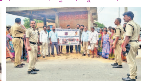
చిన్నశంకరంపేట: మత్తు పదార్థాలతో కలిగే అనర్థాలపై అవగాహన కల్పిస్తున్న పోలీసులు