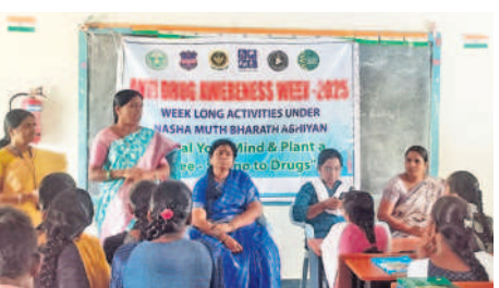
శివ్వంపేట: ప్రభుత్వ కళాశాలలో విద్యార్థులకు అవగాహన కల్పిస్తున్న అధికారులు