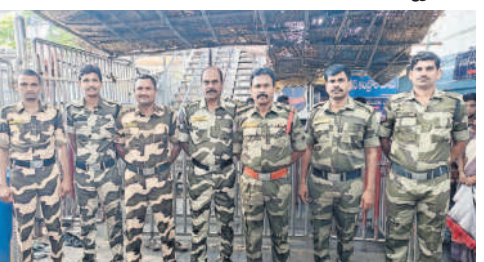
రాజన్న ఆలయంలో మిలిటరీ డైస్ కోడ్త్ భద్రతా సిబ్బంది

వేములవాడ, జూన్ 12: వేములవాడ రాజన్న ఆలయంలో ఎస్ పీఎఫ్ భద్రతా సిబ్బంది ఏఎస్ఐ ఒకరు, ఇద్దరు హెడ్ కానిస్టేబుళ్లు, పదిమంది పోలీసులు నిత్యం భద్రతాపరమైన విధులు నిర్వహిస్తు న్నారు. రాష్ట్ర పోలీసు ఉన్నతాధికారుల ఆదేశాల మేరకు ఇకపై వారంలో రెండు రోజులు మిలటరీ డ్రెస్ తో విధులు నిర్వహించను న్నారు. గురువారం డ్రెస్ కోడ్త్ విధులు నిర్వహించినట్టు ఏఎస్ఐ