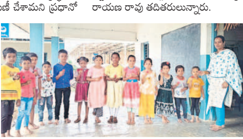
బోయినపల్లి రూరల్ : గుండన ్రపల్లిలో విద్యార్శులకు పూలతో స్వాగతం పలుకుతున్న టీచర్

ఇలంతకుంట మండల కేం దంలోని జిలా పరిషత్ ఉన్నత పాఠశాలలో విద్యార్థులకు పాఠ్య పుస్తకాలు పంపిణీ చేశామని ప్రధానో