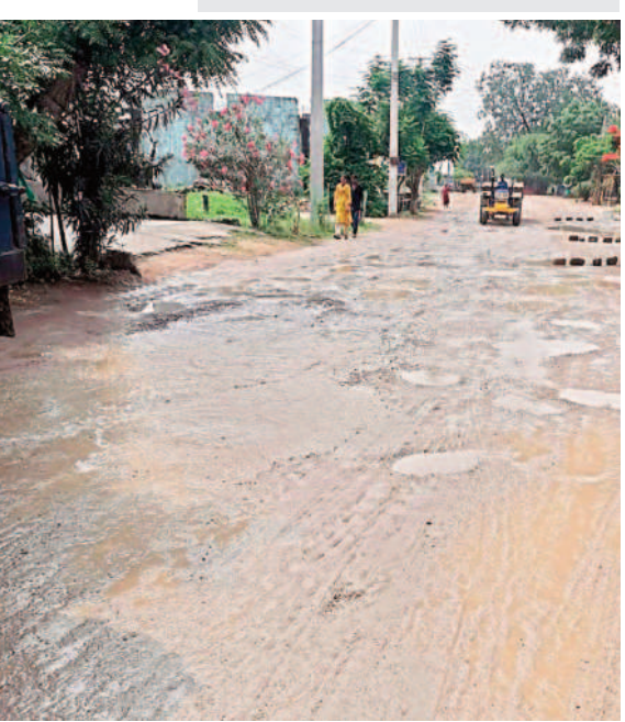
వేములవాడ పట్టణంలోని మహాలక్ష్మి వీభిలో వర్సానికి బురదమయమైన రహదాల