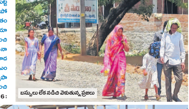
బస్సులు లేక పడిన వెతుకున్న ప్రజలు

తుర్కపల్లి మండలం తిరుమలాపురంలో నిర్వహించిన ప్రజా పాలన సభకు యాదాద్రిగుట్ట డిపో ఆర్టీసీ బస్సులు కేటాయింబడంతో గ్రామీణ ప్రాంతాలకు బస్సు సౌకర్యం నిలిచిపోయింది. దాంతో ప్రయాణికులు వివిధ గ్రామాలకు అవస్థలు పడ్డారు. ఆటోలు సైతం లేకపోవడంతో కాలినడకే దిక్కయింది. దూర ప్రాంతాలకు వెళ్లే ప్రయాణికులు తమ ప్రయాణాన్ని రద్దు చేసుకున్నారు. రాజాపేట మండలానికి నిత్యం యాదాద్రిగుట్ట డిపో నుంచి బస్సుల సౌకర్యం ఉండేది. ప్రయాణికులు గంటల తరబడి బస్సు కోసం ఎదురుచూసినా ఒక్క బస్సు కూడా రాకపోవడంతో తీవ్ర నిరాశకు గురియ్యారు. ఇక్కడి నుంచి నిత్యం యాదాద్రి గిరిగుట్ట, భువనగిరి, హైదరాబాదుకు వ్యాపారులు, ప్రయాణికులు వెళ్తుండేవారు. సీఎం సభకు బస్సులన్నీ కేటాయింబడంతో నిత్యం ఆర్టీసీలో ప్రయాణించే ప్రయాణికులు, వ్యాపారులు బస్సు సౌకర్యం లేక మండిపడుతున్నారు. పూర్తిగా బస్సులన్నీ సభలకు కేటాయింబడ ప్రయాణికులను ఇబ్బంది పుల్లొడ్డని మండల ప్రజలు కోరుతున్నారు. -రాజాపేట, జూన్ 6: