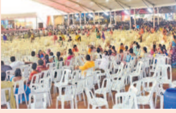
సీఎం సభలో దర్శనమిస్తున్న ఖాళీ కుర్చీలు

యాదాద్రిగుట్ట, జూన్ 6: ముఖ్యమంత్రి రేవంత్ రెడ్డి ప్రభుత్వం అధికారంలోకి వచ్చి 18 నెలలు పూర్తి కావచ్చునూ జీఆర్ఎస్ పార్టీని గానీ, మాజీ సీఎం కేసీఆర్ ను తిట్టకుండా ఉండలేదు. సరిగ్గా అదే తీరు తిరుమలాపురంలో జరిగిన బహిరంగ సభ కనిపించింది. ఆయనను కేసీఆర్ ను నిందించడం తప్ప, ఆయన విజయ చూపుతున్నారని ఎక్కడా కనిపించలేదు. దీంతో విసుగు చెందిన అభివృద్ధి పలుకులు వెనుదిరిగాయి. ఒక్కవైపు సీఎం రేవంత్ రెడ్డి ప్రసంగాన్ని ప్రారంభించి రెండు నిమిషాల్లోనే సుమారుగా 8 వేల మంది ప్రతినిధులు అభివృద్ధి పలుకులు కేటాయింబిన ప్రత్యేక లాభి ప్రాంగణాన్ని ఖాళీచేసి కనబడింది. దీంతో సభా ప్రాంగణంతో బోన్ పోయిపోతు కనిపించింది. ఇప్పటి వరకు ఎన్నో సభలు చూశామని, ఇంత నిర్బంధంగా సభలకు తీసుకువచ్చిన దాఖలాలు లేవన్నారు.