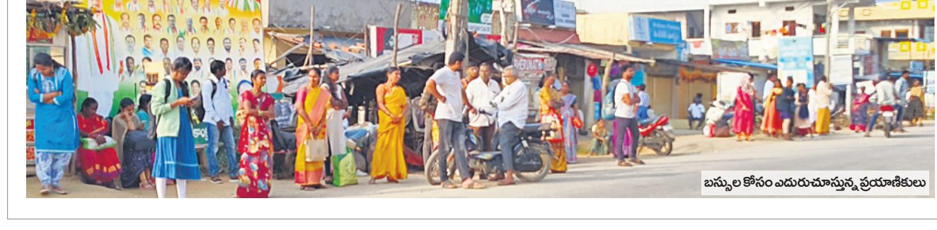
బస్సుల కోసం ఎదురుచూస్తున్న ప్రయాణికులు