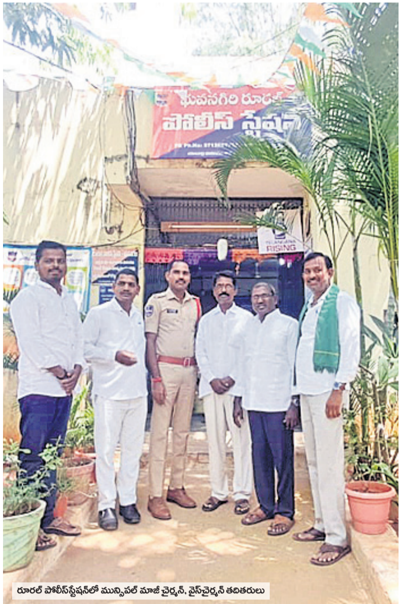
యాదాద్రి పోలీస్ స్టేషన్లో మున్సిపల్ మాజీ చైర్మన్, వైస్ చైర్మన్ తదితరులు