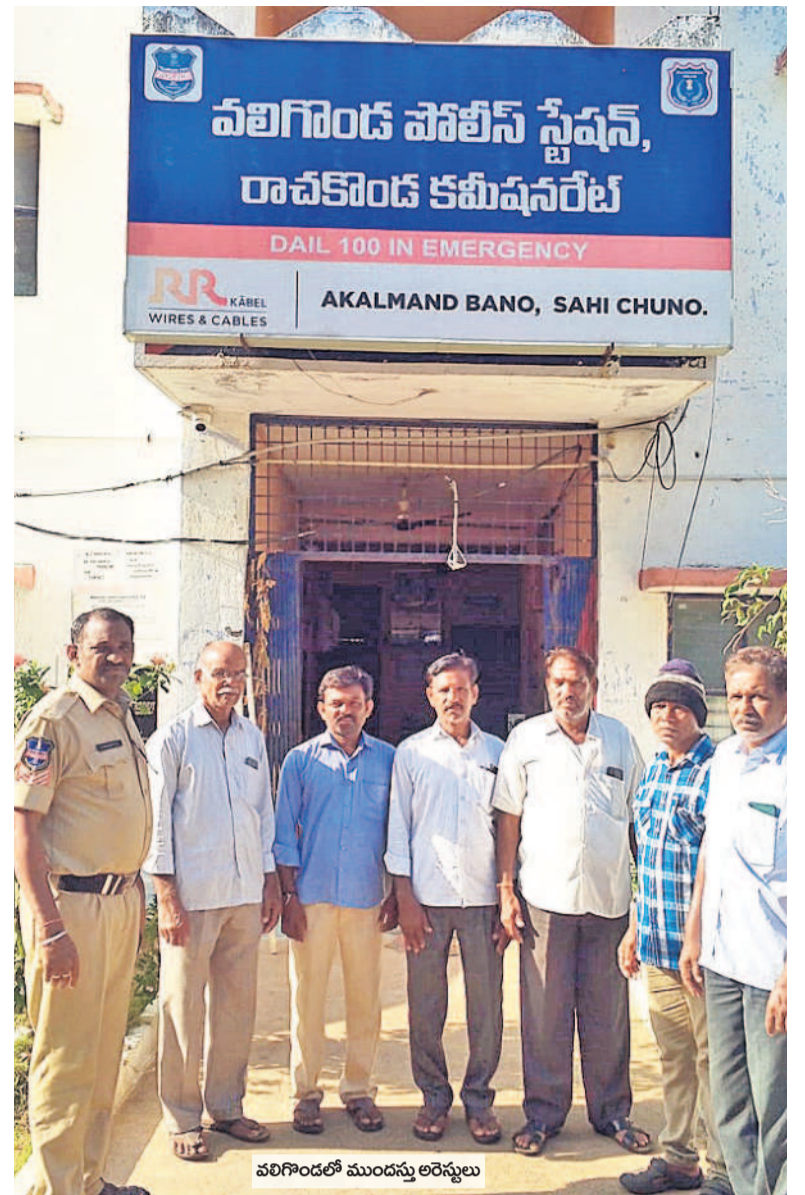
వలిగిండ్లలో ముందస్తు అరెస్టులు