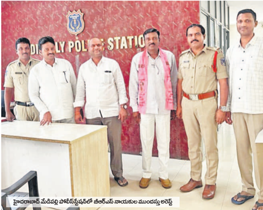
హైదరాబాద్ మేదపల్లి పోలీస్ స్టేషన్లో జీఆర్ఎస్ నాయకుల ముందస్తు అరెస్ట్