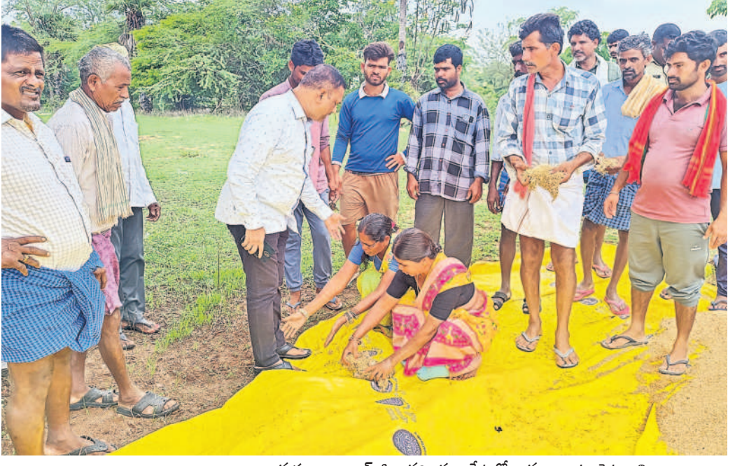
ತಾಕ್ಲು ಮುಕ್ಕು ತಾ ಬಾಂವೆನ್