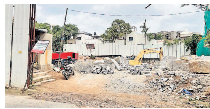
బంజారాహిల్స్ రోడ్డు నంబర్ 5లో ప్రభుత్వ స్థలంలో పనులు నిర్వహిస్తున్న దృశ్యం

షేక్ పేట మండల పరిధిలోని బంజారాహిల్స్ రోడ్డు నంబర్ 4 నుంచి దేవరకొండబస్తీకి వెళ్లే దారిలో ఎఫ్కే కన్స్ట్రక్షన్ పేరుతో 600 గజాల స్థలంలో భవన నిర్మాణం చేస్తున్నారు. దీనికోసం జీహెచ్ఎంసీ నుంచి అనుమతులు తీసుకుని బండరాళ్లు తొలగించే పనులు చేస్తున్నారు. కాగా ఆ స్థలా నికి ఆనుకుని సుమారు 400గజాల యూఎల్సీ ల్యాండ్ ఉంది. ఈ స్థలంలో ఏర్పాటు చేసిన డ్రషభుత్వ హెచ్చరిక