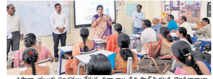
ఉపాధ్యాయులకు సూచనలు చేస్తున్న విద్యాశాఖ ప్రిన్సిపాల్ సెక్రటలీ యోగితారాణా

విద్యాశాఖ ప్రిన్సిపాల్ సెక్రకటరీ యోగితారాణా