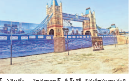
హైదరాబాద్ థీమ్తో నిర్వహిస్తున్నామని, ఇది ప్రజలను పెద్ద ఎత్తున ఆకర్షించగలదని

వారం ఈ ఎగ్జిబిషన్ను కార్వాన్ ఎమ్మెల్యే మమ్మద్ కౌసర్ మొయినుద్దీన్ ప్రారంభిస్తా రని, ఈసారి ఎగ్జిబిషన్ను లండన్ సిటీ ఇన్