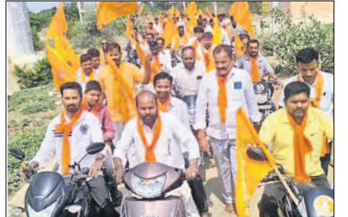
జిన్మారంలో బైక్ ర్యాలీ నిర్వహిస్తున్న హిందూ ధర్త, పలిరక్షణ ప్రచార సమితి సభ్యులు