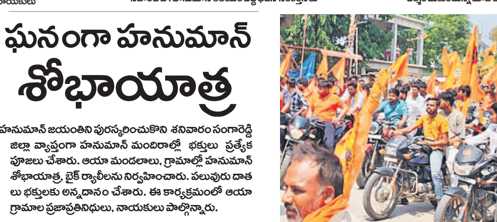
-సంగారెడ్డి జిల్లా నెట్వర్క్ పప్రిల్ 12