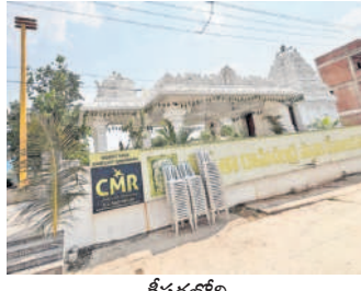
కేసరలోని శ్రీసీతారామచంద్రస్వామి ఆలయం

పోచారం : పోచారం మున్సిపాలిటీలోని పలు ప్రాంతాల్లో 6న సీతారాముల కల్యాణం నిర్వహించేందుకు గ్రామస్తులు, భక్తులు ఏర్పాట్లు చేశారు. అన్నోజిగూడ,ఇస్మాయిల్