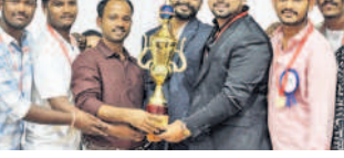
విజేతలకు బహుమతులను అందజేస్తున్న అధ్యాపకులు