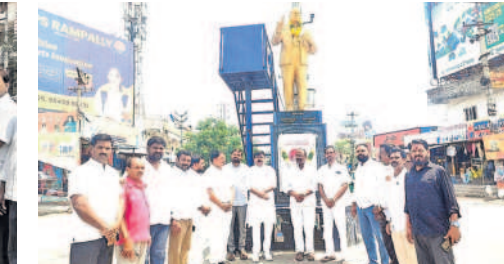
కీసర్ చౌరస్తాలో జ్యోతిరావుపూలే జయంతి వేడుకల్లో పాల్గొన్న వివిధ సంఘాల నాయకులు