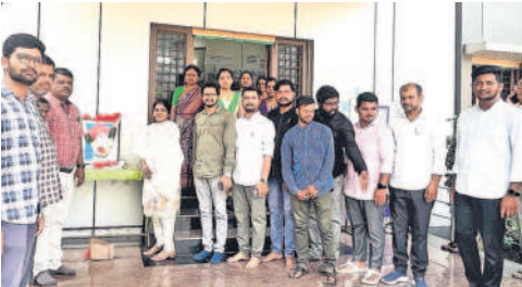
పోచారం : మున్సిపాలిటీ కార్యాలయంలో జ్యోతిరావు పూలే చిత్ర పటం వద్ద నివాళులర్పిస్తున్న అధికారులు