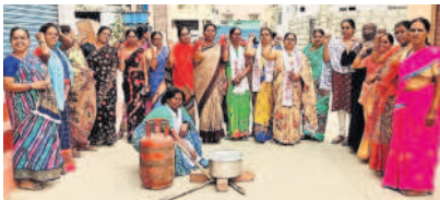
మల్కాజిగిరిలో ఐదవ అధ్యక్షుల కట్టల పొయ్యిపై వంట చేస్తూ నిరసన తెలుపుతున్న మహిళలు