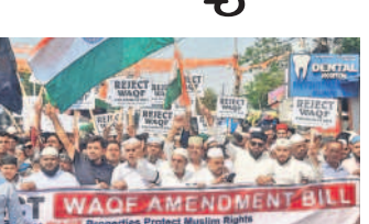
ఘటికేసర్ ఉద్ద్యంలో ర్యాలీ నిర్వహిస్తున్న ముస్లింలు