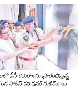
నాగరంలో సీసీ కెమెరాలను ప్రారంభిస్తున్న రాచకొండ పోలీస్ కమిషనర్ సుధీర్బాబు