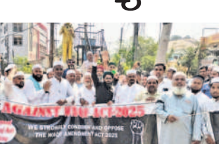
మల్కాజిగిరి నిరసన తెలుపుతున్న ముస్లిం మైనార్టీలు

మసీదుకు చెందిన ముస్లింలు పాల్గొన్నారు. మల్కాజిగిరి : కేంద్ర ప్రభుత్వం పార్లమెంట్లో ఆమోదించిన వక్స్ సవరణ బిల్లును రద్దు చేయాలని ముస్లిం మైనార్టీలు