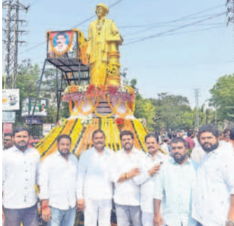
రామంతాపూర్ : విలుకానగర్లో పూలే విగ్రహం వద్ద నివాళులర్పిస్తున్న బీఆర్ఎస్ నాయకులు