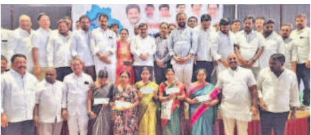
అంతామపల్లిలో కల్యాణలక్ష్మి, పాదీముబారక్ చెక్కులు పంపిణీ చేస్తున్న ఎంపీ ఈటల, ప్రభుత్వ వివీ చట్టం