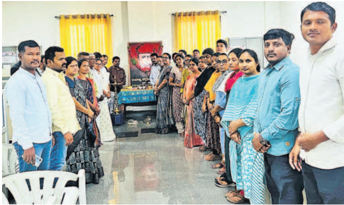
మేడ్చల్ కలెక్టరేట్లో జ్యోతిబా పూలే చిత్రపటానికి పూలమాల వేసి నివాళులర్పిస్తున్న జిల్లా అధికారులు, సిబ్బంది