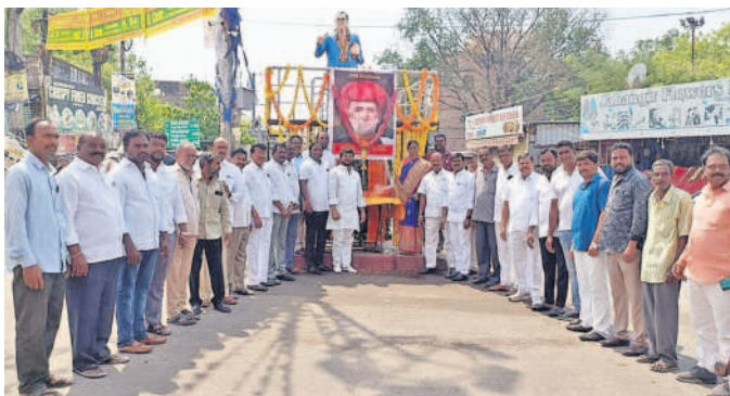
మణికేసర్ : పట్టణంలో మహాత్మా జ్యోతిరావు పూలే చిత్రపటానికి పూలమాలలు వేసి నివాళులర్పిస్తున్న నాయకులు