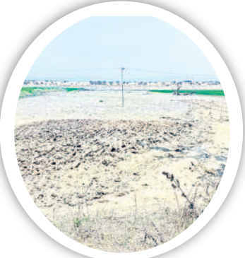
చెరువులో ఉన్న అటవీ భూమిని చదును చేసి అచ్చుకట్టించుకు యత్నిస్తున్న స్థలం

హస్తయ్య చెరువు కూడా ఎండిపోవడంతో అందులో కొందరు అచ్చుకట్టి నీర్లను చేసేందుకు ప్రయత్నించడం, కొందరు చెరువులో ఉన్న అటవీశాఖ భూమిని సైతం చదును చేసి యథేచ్ఛగా పొలం చేసుకునే ప్రయత్నిస్తుండగా గ్రామస్థులు ఫిర్యాదు చేశారు. చదును చేస్తున్న వ్యక్తులపై ఎలాంటి చర్యలు తీసుకోవాల్సిన వందపై అసహనం వ్యక్తం చేస్తున్నారు. చెరువు కట్టపై నీటిపారుదలశాఖ, రెవెన్యూశాఖ, అటవీశాఖ అధికారులకు ఫిర్యాదులు చేసినా ఫలితం లేకుండా పోయిందని వాపోతున్నారు. 29.40 ఎకరాల విస్తీర్ణం గల చెరువులో ఎలాంటి పట్టా భూమి లేదని అధికారులు చెబుతున్నప్పటికీ కొందరు తమకు పట్టా ఉందని అందులో యథేచ్ఛగా సాగు చేస్తున్నారు. పట్టా ఉన్నా ఎండాకాలం ఏకీకృత నిబంధన ప్రకారం అచ్చుకట్టి పొలం చేయకుండా ఉన్న దాన్ని దున్నాలనే నిబంధన కూడా పాలిటపడం లేదని దీంతో చెరువు వైకారానికి తగ్గి పట్టా కాలం నీళ్లు నిండితే కట్టకు ముప్పు వాటిల్లే ప్రమాదం ఏర్పడుతుందని గ్రామస్థులు ఆవేదన రువు మరమ్మత్తు పనులు చేశారు. మూడు మీటర్ల కట్టను ఎక్స్ కేవేటర్తో చెక్కి పొలం చేశారని ఇది కట్టకు ముప్పు తెచ్చే అవకాశమందని గ్రామస్థులు ఆరోపిస్తున్నారు. దీనిపై అటవీశాఖ, నీటిపారుదల శాఖ అధికారులకు ఇదవరకే పలు మార్పు చేస్తున్నట్లు పరిష్కారం చూపడం లేదని అంటున్నారు. ఇప్పటికైనా చెరువును యథావధంగా పూర్తి ఎఫ్ టీఎల్ గా ఉంచేందుకు అధికారులు ప్రయత్నించాలని గ్రామస్థులు