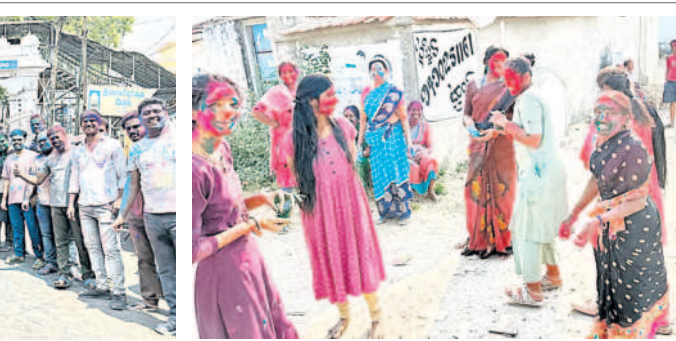
చంద్రపల్లి : రంగులు చట్టుకుంటున్న మహిళలు