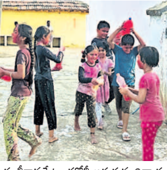
గంభీరాపురం : హోలీ ఆడుతున్న చిన్నారులు