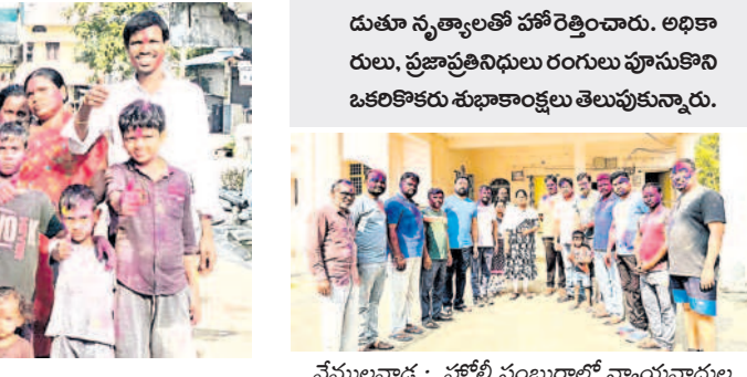
వేములవాడ : హోలీ సంబురాల్లో న్యాయవాదుల