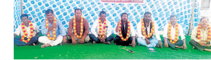
కోనరావుపేటలో రిలే నిరహార దీక్ష చేస్తున్న ఎమ్మెల్యే ఎన్ నేతలు