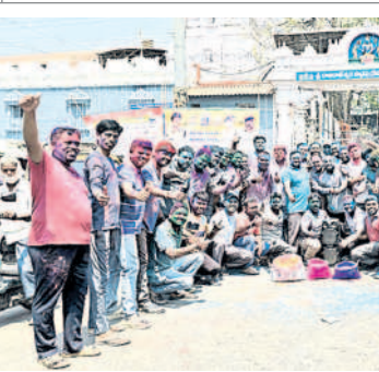
వేములవాడ : రాజన్న ఆలయం ఎదుట హోల్ సంబురాల్లో యువత