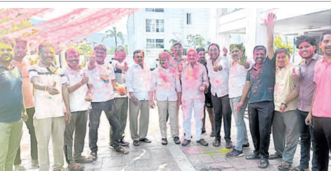
సిరిసిల్ల టౌన్ : తెలంగాణ భవన్ లో హోల్ వేడుకల్లో పాల్గొన్న బీఆర్ఎస్ నాయకులు