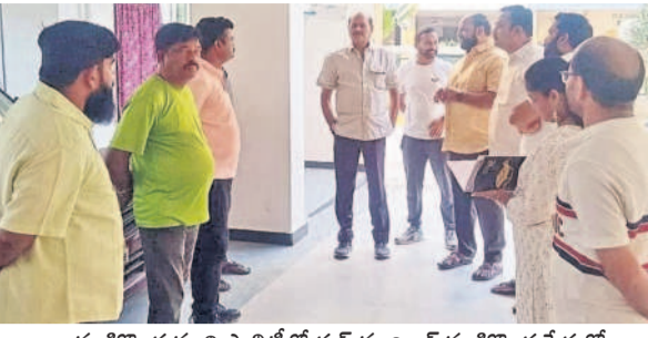
మణికొండ మున్సిపాలిటీలో గుడ్ మార్నింగ్ మణికొండ పేరుతో చేపట్టిన ప్రజాభిప్రాయ సేకరణలో భాగంగా స్థానికుల సమస్యలు తెలుసుకుంటున్న బీఆర్ఎస్ నాయకులు

ముఖ్యం చెరువు పక్కన ఉన్న ఖాళీ స్థలంలో రాత్రి కానీ కొంతమంది అసాంఘిక కార్యకలాపాలు నిర్వహిస్తున్నారని కాల నివాసాలు వాటిలోయారు.