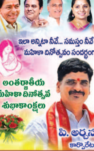
జిలా అన్నిటా సీ... సమస్యల సేవ అందుకే మహిళా దినోత్సవం సందర్భంగా మీ కిదే వందనం !!