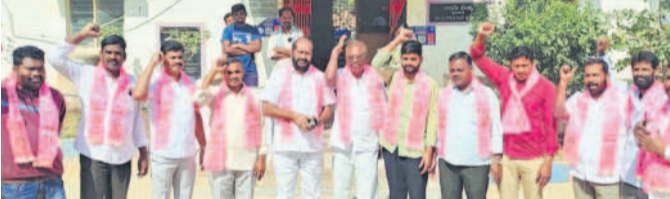
తిరుమలగిరిలో మాజీ సర్పంచ్ లు ముందస్తు అరెస్టు చేసిన పోలీసులు