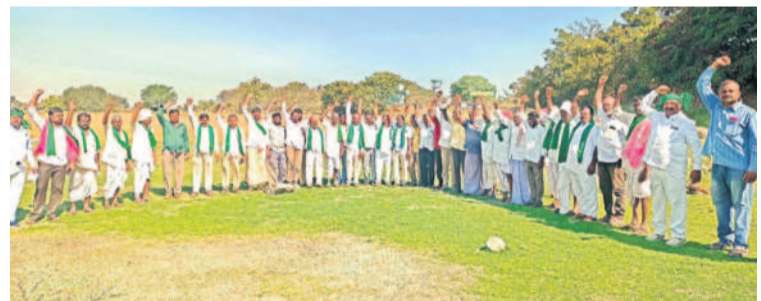
రాజాపేట : మల్లెగూడల చెరువులో నిరసన తెలుపుతున్న రైతులు

నార్కట్ పల్లి, ఫిబ్రవరి 4 : హైదరాబాద్ లో ఈ నెల 7న మాదిగలు నిర్వహించే తలపెట్టిన లక్ష డప్పులు.. వేయి గొంతులు బహిరంగ సభను మాదిగలంతా విజయవంతం చేయాలని సకీరత్ మాజీ ఎమ్మెల్యే బిరుమర్తి లింగయ్య పిలుపునిచ్చారు. నార్కట్ పల్లిలోని తన నివాసంలో మంగళవారం విలేజరుల సమావేశంలో ఆయన మాట్లాడారు. హైదరాబాద్ లో బాహు జగ్గీవన్ రామ్ విగ్రహం వద్ద నుంచి పెద్ద అంబేద్కర్ విగ్రహం వరకు నిర్వహించనున్న మాదిగల ప్రదర్శనను ప్రభుత్వం అడ్డుకుంటున్నదని, అనుమతి లేదని పాఠశాల లేని సాకులతో ఆపాలని చూస్తున్నదని ఆయన ఆగ్రహం వ్యక్తం చేశారు. మాదిగల సంఖ్యను పెంచుకోవడానికి ప్రభుత్వం ప్రయత్నించాలని, అనుమతి లేదని పాఠశాల లేని సాకులతో ఆపాలని చూస్తున్నదని ఆయన ఆగ్రహం వ్యక్తం చేశారు. మాదిగల సంఖ్యను పెంచుకోవడానికి ప్రభుత్వం ప్రయత్నించాలని, అనుమతి లేదని పాఠశాల లేని సాకులతో ఆపాలని చూస్తున్నదని ఆయన ఆగ్రహం వ్యక్తం చేశారు. మాదిగల సంఖ్యను పెంచుకోవడానికి ప్రభుత్వం ప్రయత్నించాలని, అనుమతి లేదని పాఠశాల లేని సాకులతో ఆపాలని చూస్తున్నదని ఆయన ఆగ్రహం వ్యక్తం చేశారు.