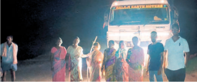
కరంల సభలో నిలిపివేయడంతో టిన్నెస్ అడ్డుకొని నిరసన తెలుపుతున్న సర్పంచ్ లు గాడి గ్రామస్థాయి

ప్రభుత్వం నుంచి చలనం లేకపోవడంతో దుడమపాలంగా ఆందోళనకు దిగారు. గత అసెంబ్లీ సమావేశాల సమయంలో సైతం చలో అసెంబ్లీకి పిలుపునివ్వగా ప్రభుత్వం పోలీసులను నిర్బంధించి అరెస్టులు చేయించింది. ఆ తర్వాత ముఖ్యమంత్రి, మంత్రుల పర్యటన సాగించారు. మాజీ సర్పంచ్ లు ముందస్తు అరెస్టు చేశారు. తెల్లవారుజాము నుంచే గ్రామాల వారిగా గుర్తింపి అదుపులోకి తీసుకుని ఆయా పోలీస్ స్టేషన్లకు తరలించారు. సాయంత్రం వరకు అక్కడే నిర్బంధించారు. గతేడాది జనవరిలో సర్పంచ్ ల పదవి