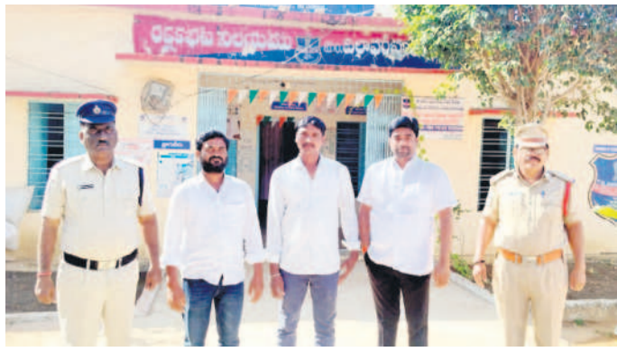
దిలావర్పూర్ పోలీస్ స్టేషన్లో మాజీ సర్పంచ్ల సంఘం జిల్లా ఉపాధ్యక్షుడు, సర్పంచ్లు