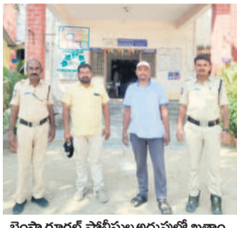
వైఎస్ఆర్ రూరల్ పోలీసుల అదుపులో ఖిల్గా, హన్మంట్ సర్పంచ్లు