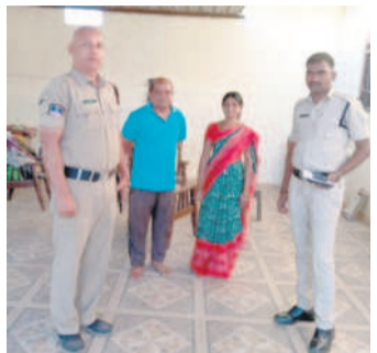
కుంటూరు సర్పంచ్లను అదుపుకు పోలీసులు