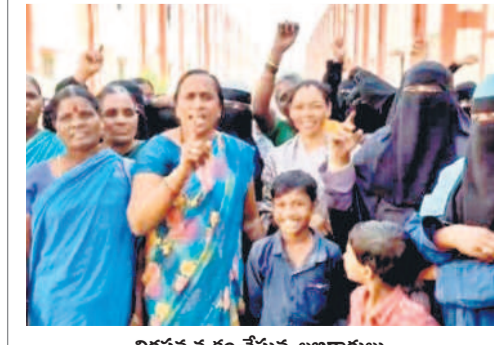
నిరసన వ్యక్తం చేస్తున్న అభిలక్షులు

భైంసా, ఫిబ్రవరి 4 : భైంసా పట్టణంలో నిర్మించిన డబుల్ బెడ్రూం ఇళ్లను గత బిల్డింగ్ ప్రభుత్వం లెక్కే ద్వారా ఎంపిక చేసింది, వెంటనే వాటిని అందించాలని అభిలక్షులు మంగళవారం డబుల్ బెడ్రూం ఇళ్ల వద్ద నిరసన చేపట్టారు. ఈ సందర్భంగా పలువురు మాట్లాడుతూ.. ఇప్పటికే కార్యాలయాల చుట్టూ తిరుగుతున్నా స్వాధీనం చేయలేదని, వెంటనే అందించాలని వారు కోరారు.