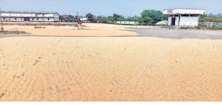
వ్యవసాయ మార్కెట్ కు భారీగా తరలివచ్చిన మక్కలు