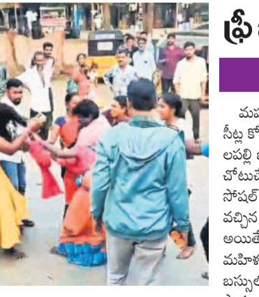
సీట్ల కోసం కొట్టుకుంటున్న మహిళలు