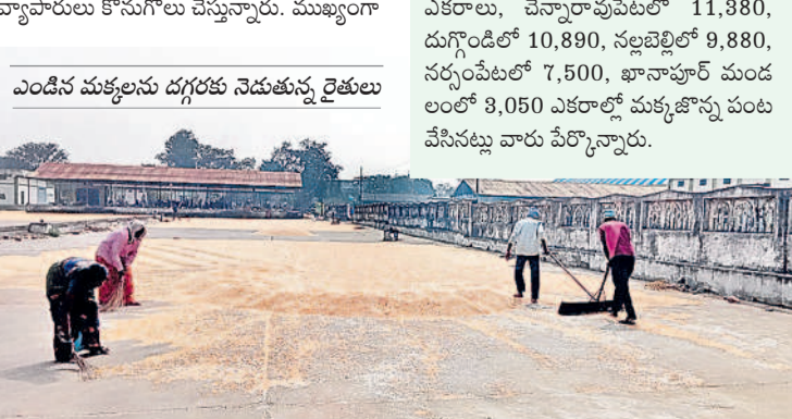
ఎండిన మక్కలను దగ్గరకు నెడుతున్న రైతులు

10 రోజుల ముందే.. ఈ ధామా మక్కలు మార్కెట్ యార్డుకు 10 రోజులు ముందుగానే వచ్చాయి. గతంలో ఫిబ్రవరి రెండో వారంలో వచ్చేవి. రైతులు వానకాండ్ల పత్తి సాగు చేయగా ఒకసారి మాత్రమే వంట ఏరి దానిని తొలగించారు. దానిస్థానంలో నవంబర్ చివరలో మక్క జొన్న వంట చేశారు. ఈ వంట 15 రోజుల ముందుగానే తోకకు రావడంతో రైతులు మార్కెట్ కు తీసుకొచ్చినట్లు అధికారులు తెలిపారు. కాగా, నర్సంపేట నియోజకవర్గంలో మొత్తం 56,150 ఎకరాలలో మక్కజొన్న సాగు సమస్య వ్యవసాయ శాఖ అధికారులు చెబుతున్నారు. నెక్కొండ మండలంలో 13,450 ఎకరాలు, చెన్నారావుపేటలో 11,380, దుగ్గిండిలో 10,890, నల్లచెల్లిలో 9,880, నర్సంపేటలో 7,500, భానాపూర్ మండలంలో 3,050 ఎకరాలలో మక్కజొన్న వంట చేసినట్లు వారు పేర్కొన్నారు.