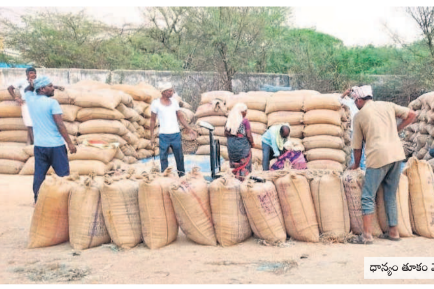
ధాన్యం తూకం వేస్తున్న సిబ్బంది (వారి)