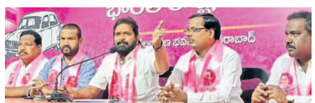
సోమవారం తెలంగాణ భవన్లో విలేజ్ కలెక్షన్లకు ముఖ్యమంత్రి శ్రీనివాస్ గౌడ్, చిత్రంలో మాజీ ఎమ్మెల్యే మెతుకు ఆనంద్, కిశోర్ గౌడ్ తదితరులు