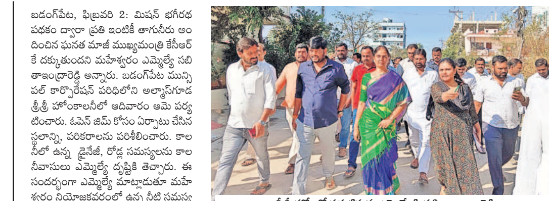
శ్రీశ్రీ హోంట్ పర్వటిస్తున్న ఎమ్మెల్యే పి నదితా ఇండ్రారెడ్డి