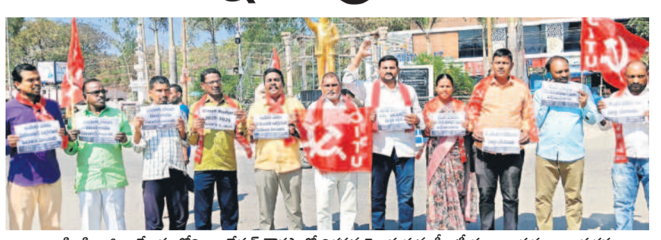
సిరిసిల్ల జిల్లా కేంద్రంలోని అంబేద్కర్ వార్డులో నిరసన తెలుపుతున్న సీబీఎస్ఎం నాయకులు, కార్యకర్తలు