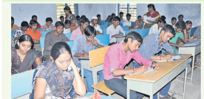
"పది" పరీక్షలకూ ముప్పుంది