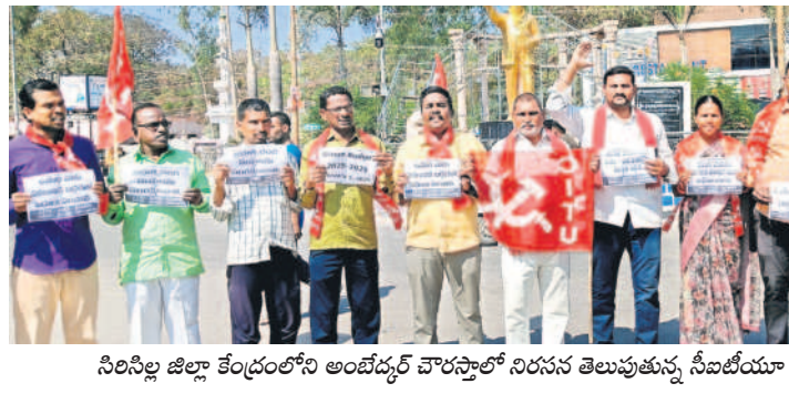
సిరిసిల్ల జిల్లా కేంద్రంలోని అంబేద్కర్ వార్డులో నిరసన తెలుపుతున్న సీబీఎస్ నాయకులు, కార్యకర్తలు