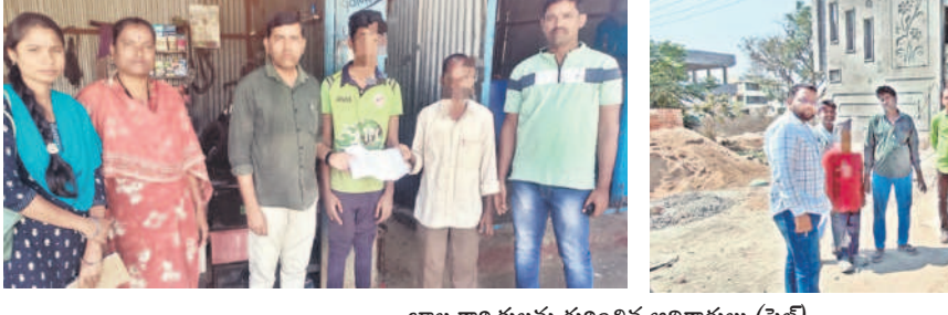
బాల కార్మికులను గుర్తించిన అధికారులు (ఫ్రైల్)