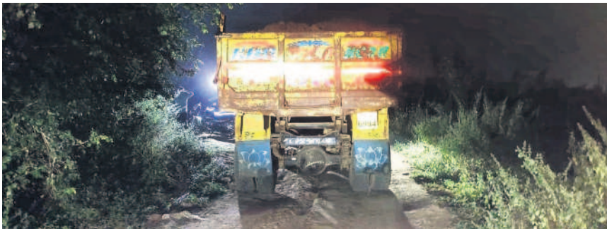
ధాత్రికటాన్ పీఠం శివారులో అర్ధరాత్రి వేళ ట్రైల్లో తరలిస్తున్న మొరం