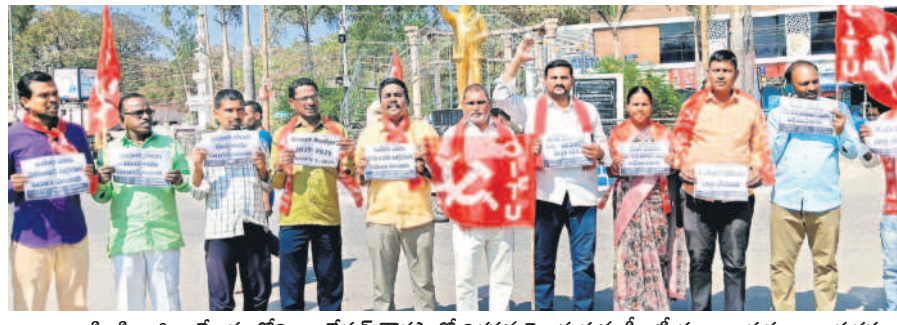
సిరిసిల్ల జిల్లా కేంద్రంలోని అంబేద్కర్ వార్డులోని నిరసన తెలుపుతున్న సీబీఎస్ నాయకులు, కార్యకర్తలు