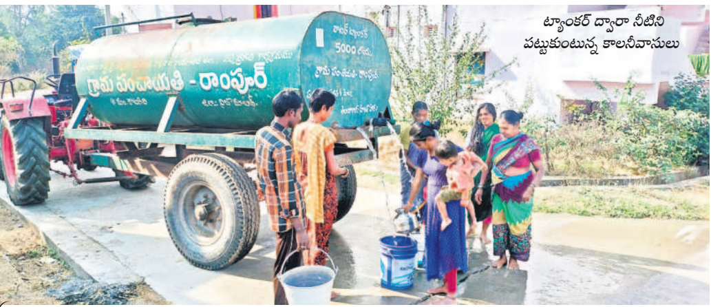
ట్యాంకర్ ద్వారా నీటి పట్టుకుంటున్న కాలనీవాసులు

క్షేత్రపర్యటనలో భాగంగా 'నమస్తే తెలంగాణ' డబుల్ బెడ్రూం ఇండ్ల సమూహాన్ని శుభ్రకారం సందర్శించాం.. కాలనీవాసులు తాగునీటి ఇబ్బందులు ఎదుర్కొంటున్నట్లు గుర్తించింది. పంచాయతీ ట్యాంకర్ వద్ద నీళ్లు పట్టుకుంటున్న దృశ్యం కనిపించింది. కొన్ని రోజుల నుంచి డబుల్ బెడ్రూం ఇండ్లకు తాగునీటి సరఫరా నిలిచిపోయింది. కాలనీవాసులు తెలిపారు. తాగునీటి సమస్యను పరిష్కరించాలని పలుమార్లు సంబంధిత శాఖ అధికారులను అడిగితే మిషన్ భగీరథ సైవర్లైన్ పగిలిపోయిందని చెబుతున్నారని వాపోయారు. సింగిల్ ఫేస్ మోటరు ఉన్నప్పటికీ కొద్దిసేపు మాత్రమే నీళ్లు వస్తున్నాయని, అవికూడా నాలుగు ఇండ్లకు కూడా సరిపోతలేవన్నారు. పైవర్తెనికు మరమ్మత్తు చేపట్టాలని మంటలు వేస్తున్నారని తెలిపారు. కాలనీలో నాలుగు ఇండ్లకు ఒక కుళాయి ఏర్పాటు చేయాలని అధికారులను కోరారు.