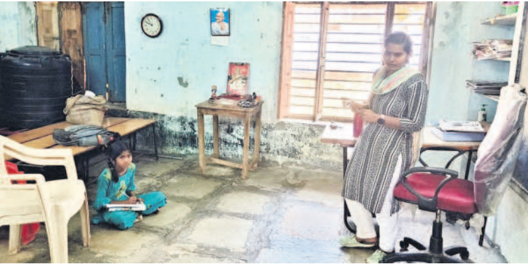
పాఠశాలకు హాజరైన ఒకే విద్యార్థిని, ఉపాధ్యాయురాలు

ఏజెన్సీ నిర్వాహకురాలి ఇంటి నుంచే మధ్యాహ్న భోజనం నిరుపయోగంగా కెవెన్, స్టార్ గదులు హాజీపూర్ సడాకీతండా పాఠశాలలో వింత పరిస్థితి