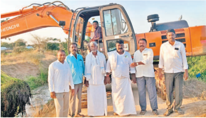
రైతులు, మత్స్యకారులు స్వచ్ఛందంగా జేసీబీ సాయంతో డీ-1 కాల్యంలో పూడికతీత పనులు చేయిస్తున్న దృశ్యం