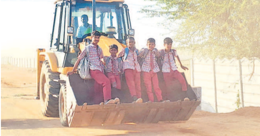
జేసీబీ బకెట్లో కూర్చోని ప్రయాణదళంతో ప్రయాణం చేస్తున్న విద్యార్థులు

జేసీబీ బకెట్లో విద్యార్థుల ప్రయాణం నవాబ్పేట, జనవరి 31 : మారుమూల గ్రామాల నుంచి ప్రభుత్వ పాఠశాలలకు వెళ్లే విద్యార్థులకు ప్రయాణం ప్రాణసంకటంగా మారింది. సరైన రవాణా సౌకర్యం లేక నిత్యం సరకయాతన అనుభవిస్తున్నారు. ప్రతి రోజూ సందెనిమిది కిలోమీటర్లు సడవలేక రోడ్ల వెంబడి ఏ వాహనం వస్తే అది ఎక్కో భయ భయంగా ప్రయాణిస్తున్నారు. ఇందుకు అడ్డం పట్టే ఘటన లింగంపల్లి గ్రామవాసుల్లో దర్శనమిచ్చింది. ఇందుకు సంబంధించి వివరాలిక్కో