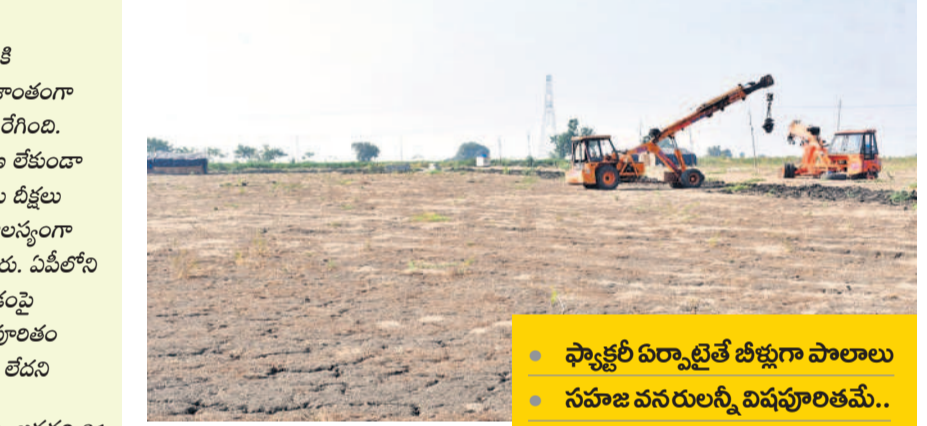
పాల్వెల ఏర్పాటు చేసే ప్రదేశం

వచ్చని పల్లెల్లో 'ఇదనాల' మంటలు రాజుకున్నాయి. పాల్వెల పేరు విందినే రైతులు ఉలిక్కిపడుతుండగా.. గ్రామాల వణుకుతున్నాయి. పెద్ద ధన్నాడ వద్ద పాల్వెలకి అనుమతులు ఇవ్వొద్దంటూ స్థానికుల నుంచి వ్యతిరేకత వ్యక్తమవుతోంది. ప్రశాంతంగా ఉన్న ప్రాంతాల్లో 10 వేల ఎకరాలపై తీవ్ర ప్రభావం వడుతుండడంతో చివ్వు లేగింది. 12 గ్రామాల వాసులు తిరుగుబాటులా ఎగురవేశారు. ప్రజాభిప్రాయ సేకరణ లేకుండా కంపెనీకి ఎలా అనుమతులు ఇస్తారని ఆగ్రహం వ్యక్తం చేస్తూ రైతులు, ప్రజలు దీక్షలు చేపట్టారు. దీంతో రాజీవ్ మండలంలో ఒక్కసారిగా హైబిస్సన్ మొదలైంది. అలస్యంగా మేలోన్న రైతులు ఈ పాల్వెల మాకోట్లు.. అంటూ తిరుగుబాటులా ఎగురవేశారు. ఏదీలోని చిత్తూరు జిల్లా మదనపల్లికి చెందిన వ్యక్తికి ఇక్కడే నాయకులు పల్లకంపై ఆగ్రహం వ్యక్తమవుతోంది. పాల్వెల ఏర్పాట్లతో ఇక్కడే సహజ వనరులన్నీ విషవృంతం అవుతాయని అంటున్నారు. ఇంత జరుగుతున్నా ప్రభుత్వం పట్టిం చెరువు లేదని స్థానికులు ఆగ్రహం చెందుతున్నారు.