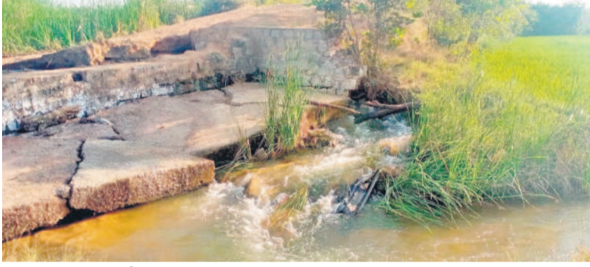
పాలవహుద్లోని దొడమోనికుంట అలగు వద్ద గండి పడి వూగూరి దిగువకు పారుతున్న నీళ్లు

గోపాల్పేట, జనవరి 31 : మండలంలోని పాలవహుద్ గ్రామ శివారులోని దొడమోని కుంటకు గండి పడి నీళ్లు ఖాళీ అవుతున్నాయి. దీంతో కుంట కింద సాగు చేసిన రైతులతోపాటు, సమీపంలోని బోతుబాల్ల రైతులు ఆందోళన చెందుతున్నారు. కుంటలో నీళ్లు ఉంటే అయిజు రైతులతో కాకుండా, బోతు బాల్ల రైతులకు మేలు జరుగుతుంది. ఎగువనున్న బొంతల కుంట నుంచి వచ్చే నీటి ఎల్వె నీళ్లతో దొడమోని కుంట నిండుతున్నది. ప్రస్తుతం కేవలం నీళ్లు దొడమోని కుంటకు వస్తున్నా, కుంటకు అలగు వద్ద గండి పడడంతో, అలగు ద్వారా