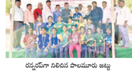
రన్నరమ్ గా నిలిచిన పాలమూరు జిల్లా