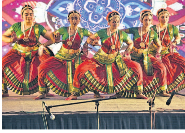
సంగీతానికి అనుగుణంగా నృత్యం చేస్తున్న యువతులు

తెలుగు యూనివర్సిటీ, జనవరి 31: వివిధ సంస్కృతులకు నిలయంగా మారిన హైదరాబాద్ చరిత్రను మంతగా ఇసుమడింపజేసే విద్యార్థుల విద్యార్థులు తెలుగు, హిందీ, ఆంగ్ల భాషల్లోని అద్భుతమైన సాహిత్యం కుడిన పాటలకు తమదైన శైలిలో ఆడిపాడారు. కింగ్ డి.ఎం. ఆర్. సె. యిల్ జోసిఫ్ డి.గ్రీ, పీజీ కళాశాల అధ్యక్షుడు శుక్రవారం జరిగిన జోసిఫెస్టా-2025 కార్యక్రమం అధ్యక్షం హోరెక్కింది. సుజ్ఞానాత్మక కళాప్రతిభలో సంగీతానికి అనుగుణంగా పాటలు పాడుతూ నృత్యాలు చేస్తూ జోసిఫెస్టా-2025 కార్యక్రమం హోరెక్కింది. జోసిఫెస్టా-2025 కార్యక్రమం అధ్యక్షం హోరెక్కింది.