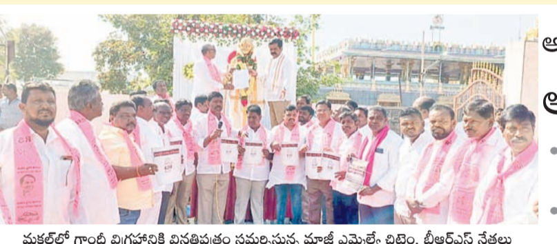
మక్తల్లో గాంధీ విగ్రహానికి వినతిపత్రం సమర్పిస్తున్న మాజీ ఎమ్మెల్యే చిట్టెం, బీఆర్ఎస్ నేతలు

మక్తల్, జనవరి 30 : కాంగ్రెస్ పార్టీ అధికారంలోకి వచ్చిన 420 హామీలను నెరవేరేయడం లేదని ఆరోపించారు. కాంగ్రెస్ పార్టీ అధికారంలోకి వచ్చిన 420 హామీలను నెరవేరేయడం లేదని ఆరోపించారు. కాంగ్రెస్ పార్టీ అధికారంలోకి వచ్చిన 420 హామీలను నెరవేరేయడం లేదని ఆరోపించారు. కాంగ్రెస్ పార్టీ అధికారంలోకి వచ్చిన 420 హామీలను నెరవేరేయడం లేదని ఆరోపించారు.