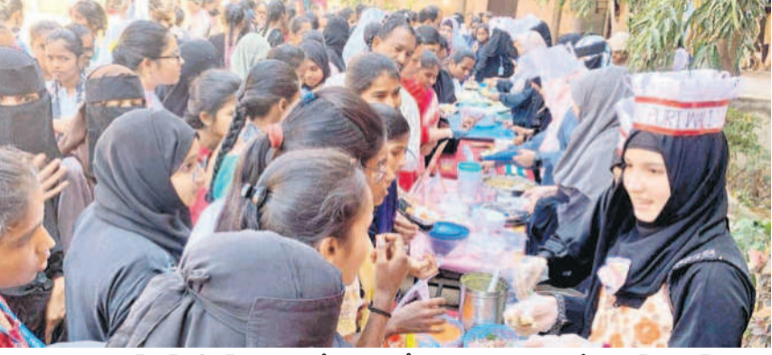
మహబూబ్ నగర్ ఎన్టీఆర్ మహిళా డిగ్రీ కళాశాలలో విద్యార్థిణుల ఏర్పాటు చేసిన పుడ్ ఫెస్టివల్