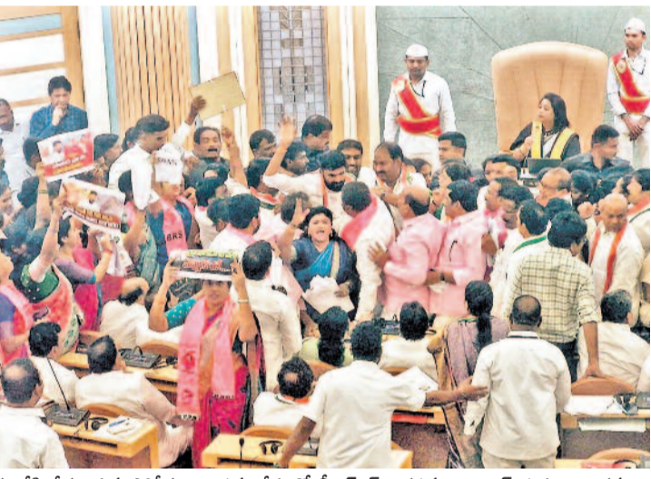
జీహెచ్ఎంసీ పాలకమండలి భేటీ నుంచి బీఆర్ఎస్ కార్యకర్తలను అరెస్టు చేసి తీసుకెళ్తున్న పోలీసులు.. సమావేశంలో బీఆర్ఎస్ నిరసనపై కాంగ్రెస్ నభ్యుల దౌర్భాగం