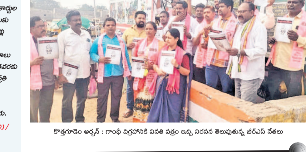
కొత్తగూడెం అర్బన్ : గాంధీ విగ్రహానికి వినతి పత్రం ఇచ్చి నిరసన తెలుపుతున్న బీఆర్ఎస్ నేతలు