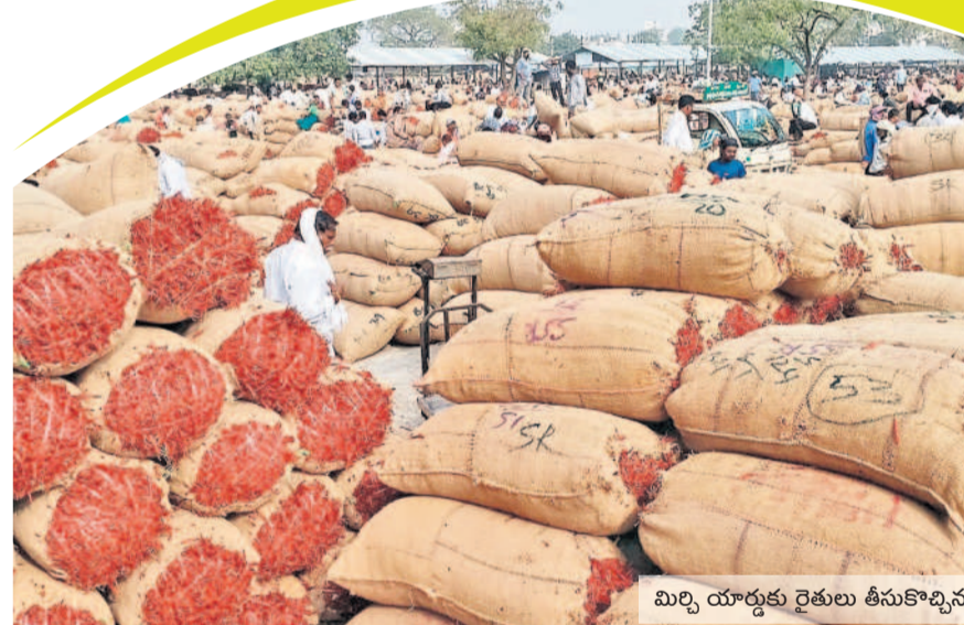
మిర్చి యార్డుకు రైతులు తీసుకొచ్చిన మిర్చి బంబాలు