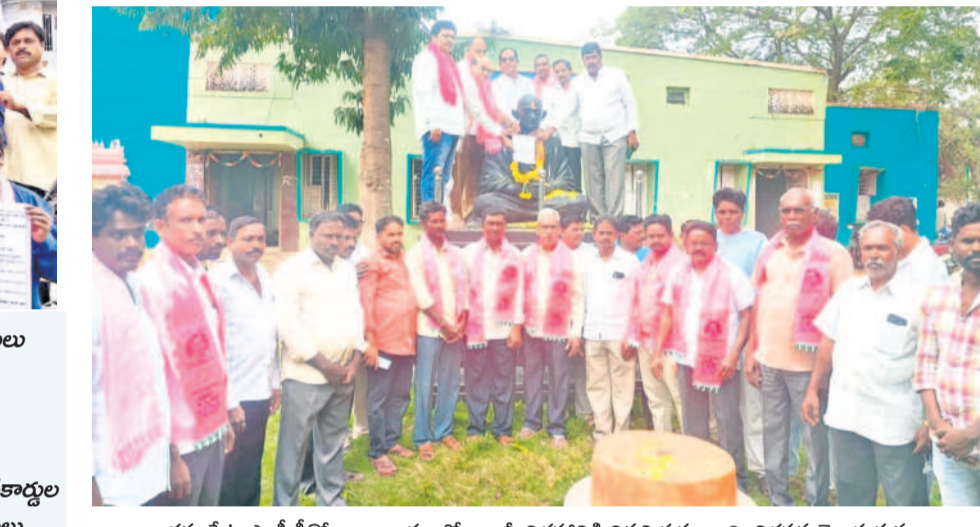
దమ్మపేట ఎంపీడివో కార్యాలయంలో గాంధీ విగ్రహానికి వినతి పత్రం ఇచ్చి నిరసన తెలుపుతున్న మాజీ ఎమ్మెల్యే మెచ్చా, నాయకులు