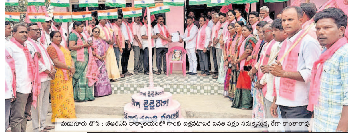
మహబూబ్ నగర్ : బీఆర్ఎస్ కార్యాలయంలో గాంధీ చిత్రపటానికి వినతి పత్రం సమర్పించును. రేగా కాంతారావు