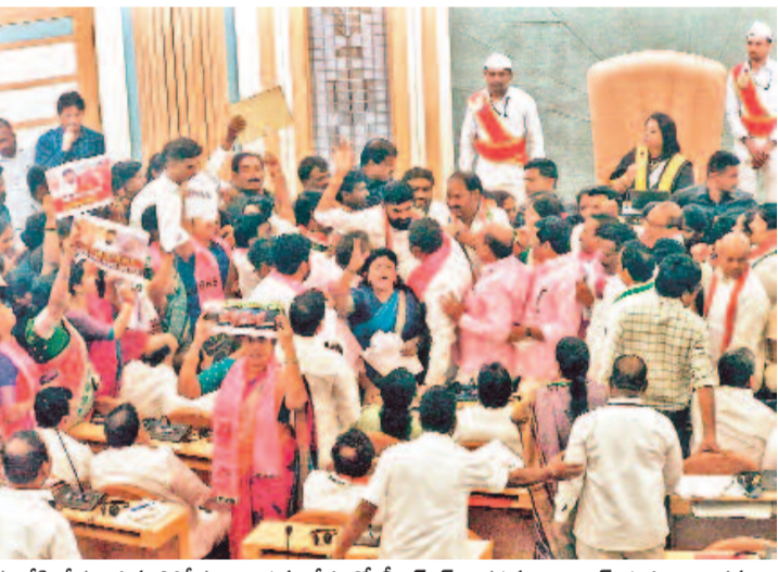
జీహెచ్ఎంసీ పాలకమండలి భేటీ నుంచి బీఆర్ఎస్ కార్యకర్తలను అడ్డు వేసి తీసుకెళ్తున్న పోలీసులు.. సమావేశంలో బీఆర్ఎస్ నిరసనపై కాంగ్రెస్ నభ్యుల దౌర్భాగం