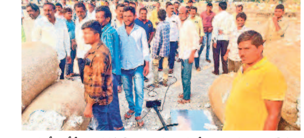
ఒక్కరోజులోనే పత్తి ధరను క్వింటాలుకు రెండు వేలు తగ్గించడంపై నిరసనపై మద్దతు తెచ్చుకున్న పత్తి రైతులు

నేటి నుంచి పార్లమెంటు బడ్జెట్ సమావేశాలు తొలి రోజు ఉభయ సభలను ఉద్దేశించి రాష్ట్రపతి ప్రసంగం 1న బడ్జెట్ ప్రవేశపెట్టనున్న నిర్ణయం వక్ర సహా 16 బిల్లులను సభ ముందుంచనున్న సర్కార్ >7