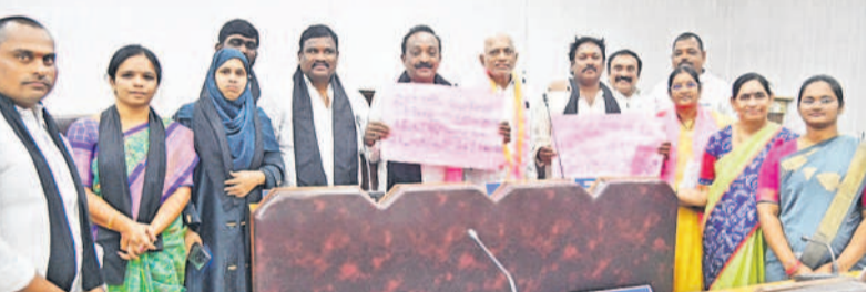
ప్రభుత్వం నిరసన తెలుపుతున్న బీఆర్ఎస్ కార్మికులు

23 ఎజెండా అంశాలకు ఆమోదం గ్రేటర్ వరంగల్ మున్సిపల్ కార్మికుల సర్వ సమావేశం ముందుకు వచ్చిన 23 ఎజెండా అంశాలకు సభ్యులు ఏకగ్రీవంగా ఆమోదం తెలిపారు. సగరంలో చేపట్టుతున్న రూ. 65.80 కోట్ల అభివృద్ధి పనులకు పరిపాలన అనుమతులు మంజూరు చేశారు. ముఖ్యంగా సగరంలో అందర్ గ్రౌండ్ డ్రైనేజీ రూ. 4,170 కోట్ల అంచనాలతో రూపొందించిన డివిజన్లకు పరిపాలన అనుమతులు మంజూరు చేశారు. 15వ ఆర్థిక సంఘం నిధులతో సర్వ ఆటోల కోసుగోళ్లు, కాజీబుగ్గ, కాజీపేట సర్కిళ్ల పరిధిలో బయో మైనింగ్ ప్రాజెక్టులు యూనిట్ల ఏర్పాటును ఆమోదించారు. సిప్లెమ్ ఎంటర్ ప్రైజ్ లో నిల్వ చేసిన అలాంటి వరకు ఉన్న ప్రధాన రహదారి పేరును రెడ్ క్రాస్ మార్కెట్ మార్చడానికి ప్రతిపాదనలు ప్రభుత్వానికి పంపించేందుకు, వర్క కాలంట్రాక్ పద్ధతిలో పని చేస్తున్న 452 మంది పారిశుధ్య కార్మికుల వేతనాన్ని రూ. 16,600కు, కార్మికుల ఛార్జీ వాహనాలు సదుపాయాలను జేబీ సోల్వింగ్ డ్రైవర్లు, డిప్యూటీలైట్ల పద్ధతిగా పనిచేస్తున్న వారి వేతనాలు రూ. 20,500కు పెంచుతూ ప్రభుత్వానికి ప్రతిపాదనలు పంపించేందుకు ఆమోదించారు.