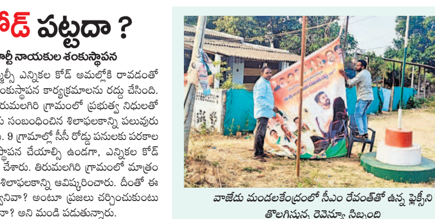
వాణిజ్య మండలకేంద్రంలో సీఎం రేపంత్తో ఉన్న ఫైట్స్ లోలోలోని రెవెన్యూ సెల్లో

వరంగల్, జనవరి 29 : ల్యాండ్ రెవ్యూరైజేషన్ స్కీం (ఎల్ఆర్ఎస్) గందరగోళంగా మారింది. బిల్డియా, రెవెన్యూ, ఇరిగేషన్ శాఖల మధ్య సమన్వయ లోపం ఎల్ ఆర్ఎస్కు అడ్డంకిగా మారింది. కార్మికుల కోట్ల కోట్ల ఆదాయం తెచ్చే పేజీ ఎల్ఆర్ఎస్ స్కీంపై బిల్డియా అధికారులు దృష్టి సారించడం లేదు. రెండు నెలలుగా క్షేత్రస్థాయిలో ఒక్క దరఖాస్తు కూడా బిల్డియా క్రియర్ చేయలేదు. గ్రేటర్ కార్మికులలో ఎల్ఆర్ఎస్ కోసం లక్షకు పైగా దరఖాస్తులు రాగా, అందులో ఇప్పటి వరకు వందల్లో మాత్రమే అధికారులు క్రియర్ చేశారు. ప్రభుత్వం వివిధ పథకాల సంబంధించిన సర్వేలు చేయించడంతో బిల్డియా అధికారులు కోట్లాది రూపాయలు తెచ్చిపెట్టే ఎల్ ఆర్ఎస్పై దృష్టి పెట్టడం లేదు. గత రెండు నెలలుగా దరఖాస్తు క్రియర్ చేసిన అధికారులు ఒక్క పెట్టారు. ఎల్ ఆర్ఎస్ వేగవంతం చేయాలని కమిషనర్ నాలుగు సమీక్షలు నిర్వహించడం తప్ప చేసిందేమీ లేదన్న విషయం వెలుగుతున్నాయి. సహకారం చేయని అధికారులు ఎల్ఆర్ఎస్ దరఖాస్తు క్రియర్ చేసిన బాధ్యతను మూడు శాఖలకు అప్పగించారు. రెవల్ 1లో మున్సిపల్, 2లో రెవెన్యూ, 3లో ఇరిగేషన్ అధికారులు క్షేత్రస్థాయిలో పరిశీలించి ఆమోదించే రెవల్ 4లో దరఖాస్తుదారులు ఎల్ఆర్ఎస్