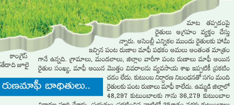
18 గంటల లక్షలో రుణమాఫీ బాధితులు..

కేసీఆర్ హయాంలో పండుగలా సాగిన వ్యవసాయంతో రైతులకు ఉన్న రైతుల పరిస్థితి రేపంతో సర్కారు రాకతో తలకిందులైంది. నలవదా అందని సాగునీళ్లు, కరెంటు కోతలు, పెట్టుబడికి ఇబ్బందులు, కొందరితో రుణమాఫీ, వడ్డీలు బోనస్.. ఇలా ఏ ఒక్కటి సరిగ్గా అందకపోవడంతో ఆగమపుతున్నది. పంట పండించడం ఒక్కటి తెలిసిన రైతులకు ప్రభుత్వం నుంచి ఎలాంటి భరోసా లేకపోవడంతో రైతులు అన్ని దశల్లో తీవ్ర ఇబ్బందులు పడుతున్నారు. అధికారంలోకి వచ్చినప్పటి నుంచి రైతు సంక్షేమ అని చెప్పడమే తప్ప అమలుచేయకపోవడంతో ముందుకు సాగలేక పెట్టుబడి కోసం తెచ్చిన అప్పులు భారమై తనపై చాలిస్తున్నాయి. ఈ నేపథ్యంలో రైతుల బలవస్తరణలపై అధ్యయనం చేసే బాధ్యత కుటుంబాలకు అండగా నిలిచేందుకు బీఆర్ఎస్ కదిలివస్తోంది. మాజీ మంత్రి సింగిరెడ్డి నిరంజన్రెడ్డి నేతృత్వంలో గురువారం వరంగల్ జిల్లా సంగం మండలం పల్లారుగూడలో వర్కలించి భరోసా కల్పించనున్నది. కాంగ్రెస్ అధికారంలోకి వచ్చినప్పటి నుంచి వ్యవసాయంలో గంిలో నెలకొన్న సంగం మండలం పల్లారుగూడలో వర్కలించి భరోసా తెలుసుకోని రైతులతో ముఖాముఖీ నిర్వహించనున్నది. -వరంగల్, జనవరి 29 (నమస్తే తెలంగాణ ప్రతినిధి)