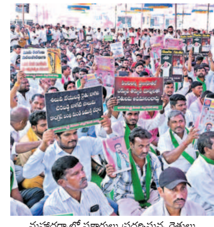
మహాధర్నాలో పాల్గొన్న రైతులు