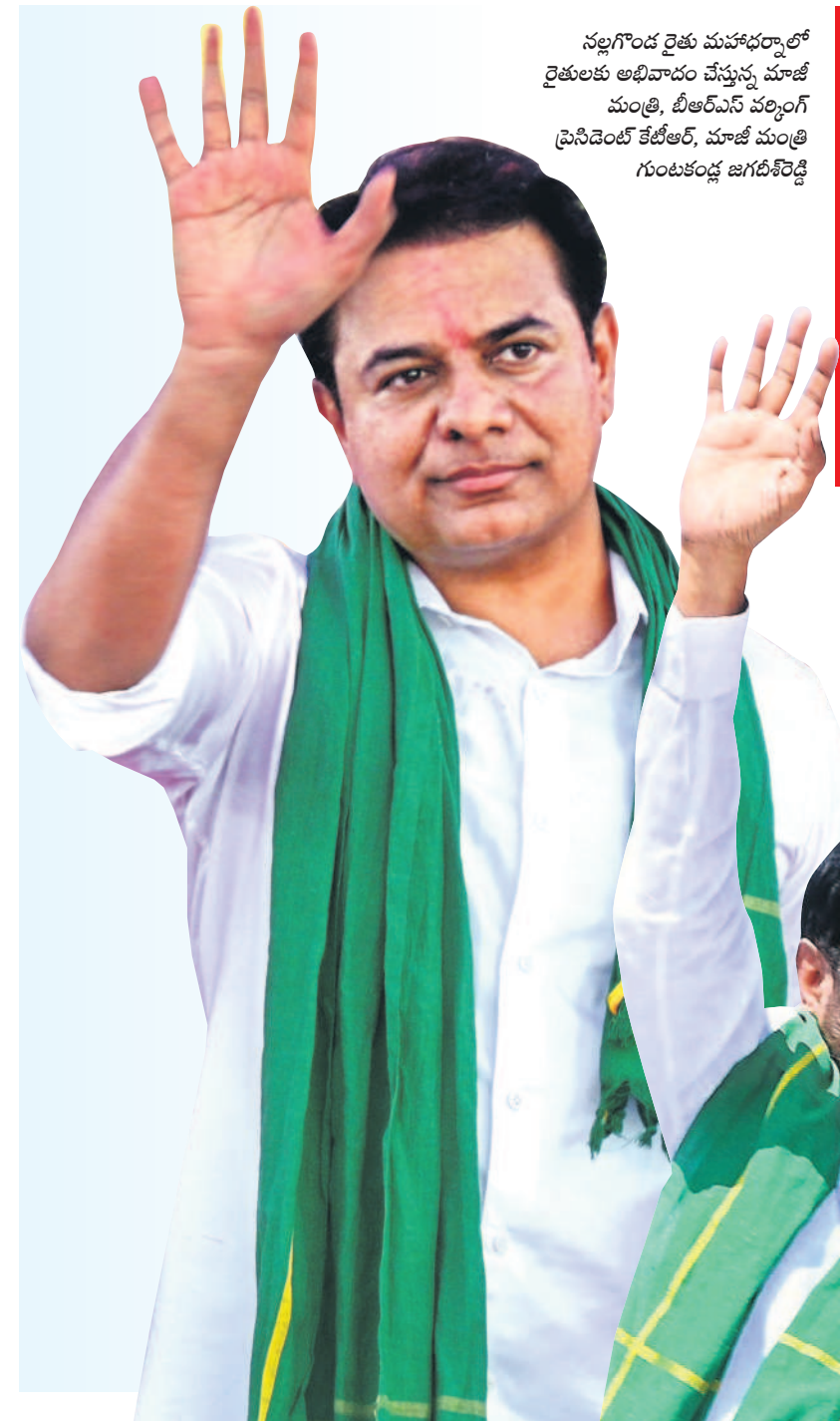
నల్లగొండ రైతు మహాధర్మాలో రైతులకు అభివాదం చేస్తున్న మాజీ మంత్రి, బీఆర్ఎస్ వర్కింగ్ ప్రెసిడెంట్ కేటీఆర్, మాజీ మంత్రి గుంటకండ్ల జగదీశ్ రెడ్డి