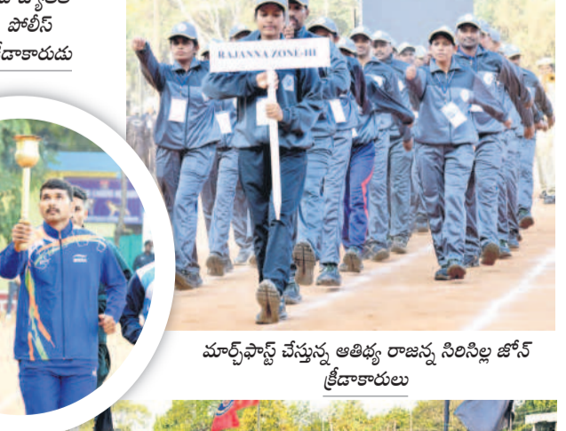
మార్చి ఫ్యాన్స్ చేస్తున్న అతిథ్య రాజస్థాన్ సినిల్ల జిప్సో క్రీడాకారులు