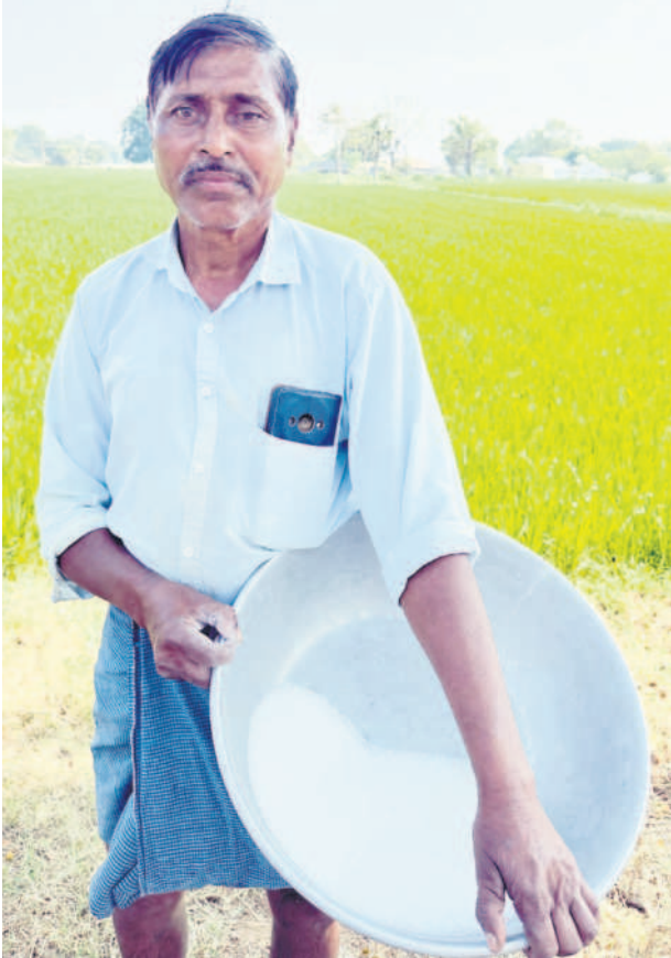
ఫోన్లో టింగ్ లేదు.. టంగ్ లేదు..

రాష్ట్ర ప్రభుత్వం అమలు చేస్తున్న నాలుగు సంక్షేమ పథకాలకు ఎంపికైన పైలట్ గ్రామాల్లో పరిస్థితి అగమ్యగోచరంగా తయారైంది. ఒక్క రైతు భరోసా మినహా ఏ పథకంలోనూ స్పష్టత లేకపోవడం అభిదారులను తీవ్ర నిరాశకు గురి చేస్తున్నది. ఇందిరమ్మ ఆత్మీయ భరోసాకు దరఖాస్తు చేసుకున్న కొద్ది మందిలోనూ అర్హతకు పోటీ కలిగిపోవడంపై ఆగ్రహం వ్యక్తమవుతున్నది. ఉమ్మడి జిల్లాలో మండలానికి ఒక గ్రామాన్ని ఎంపిక చేసిన అధికారులు, కొన్ని గ్రామాల్లో ఉత్త కాగితాలు చేతిలో పెట్టి ప్రాసీడింగ్లు చెప్పిన పరిస్థితి కనిపిస్తున్నది. కొన్ని గ్రామాల్లో పలు పథకాలకు ఎంపికైన అభిదారులకు ప్రాసీడింగ్లు కూడా చేతికిరావట్టు తెలుస్తున్నది. కాగా, తమ పరిస్థితి ఏంటని, తమకొస్తున్న గ్రామ సభలు నిర్వహిస్తారని మిగతా గ్రామాల ప్రజాసభల ప్రశ్నిస్తున్నది.