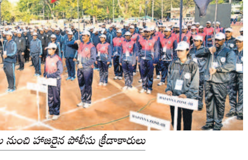
పలు జిప్సీల నుంచి హాజరైన పోలీస్ క్రీడాకారులు