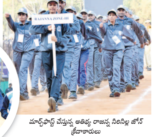
మార్చిఫ్యాన్స్ చేస్తున్న అతిథ్య రాజస్థాని సిరిసిల్ల జిప్సీ క్రీడాకారులు