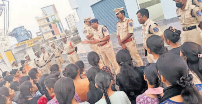
విద్యార్థినులకు షీట్ మ్యూ, డయల్ 100పై అవగాహన కల్పిస్తున్న పోలీస్ రాజు

రంగారెడ్డి, జనవరి 27 (నమస్తె తెలంగాణ) / ఇల్లంపల్లెం రురల్ : జిల్లా శివారు ప్రాంతాల్లో హాస్టల్ లో ఉంటున్న విద్యార్థినుల భద్రతపై పోలీసులు దృష్టి సారించారు. ఇటీవల అమ్మాయిలు ఉండి హాస్టల్ వద్ద పోలీస్ ఆగడాలు అధికమయ్యాయి. తాజాగా.. ఇల్లంపల్లెం రాజా పల్లిలోని మంగల్ వల్ల విద్యార్థినులకు డయల్ 100, షీట్ మ్యూ వినియోగంపై అవగాహన కల్పిస్తున్న పోలీసులు హాస్టల్ లో ఉంటున్న విద్యార్థినులను అత్యధికంగా పుటలను పోలీసులు సీలయినగా తీసుకున్నది. విద్యార్థినులు ఉంటున్న హాస్టల్ వద్ద నిఘాను పెంచుకుంటూ డయల్ 100, షీట్ మ్యూ వినియోగంపై అవగాహన కల్పిస్తున్నది. ముఖ్యంగా ఇల్లంపల్లెం పరిసర