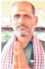
ఆత్మహత్య చేసుకున్న యువకుడు (పై)

జాబితాలో పేరు లేదని ఉరోసుకున్న యువకుడు కాల్యక్రమాల మందలం కిష్టంపేటలో ఘటన బస్సులో కొడుకు పేరు రాలేదని అగిన తంది గుండె ఖమ్మం రూరల్ మండలం తెల్లారపల్లిలో విషాదం ఒకే ఇంటి నంబర్ పై నలుగురికి ఇండ్ల మంజూరు జనగామలో కలెక్టర్ కు ఇంటి యజమాని ఫిర్యాదు నాకు ఇందిరమ్మ ఇల్లు రాకపోతే నిన్ను చంపిస్తా!