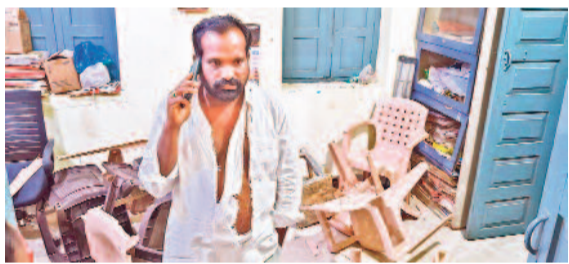
అచ్చంపేట మార్కెట్ కార్యాలయంపై రైతులు జరిపిన దాడిలో అంగీ విలగిన మార్కెట్ కమిటీ చైర్మన్ భర్త. ద్వారంపై ఆపీస్ భర్త దాడి

మద్దతుధర్మపై భగ్గుమన్న అన్నదాతలు.. ఒక్క రోజులోనే ధర్మ 3 వేలు తగ్గడంపై ఆగ్రహం అచ్చంపేట మార్కెట్లో ఫర్వాలేదేనో.. సెక్టరల్ టోపాటు చైర్మన్ భర్త దాడి అచ్చంపేట/అచ్చంపేటబోస్/కలెక్టర్ రూరల్, జనవరి 27: పల్లికి మద్దతు ధర్మ దక్కకపోవడంతో కడుపు మండిన రైతులు సోమవారం నాగర్ కర్నూల్ జిల్లా అచ్చంపేట మార్కెట్ కార్యాలయంపై దాడి చేశారు. మార్కెట్ సెక్టరల్ టోపాటు చైర్మన్ భర్త దాడికి దిగారు. కార్యాలయంలోని ఫర్వాలేదేనో ద్వారం నుంచి చేశారు. కలెక్టర్ లోనూ రైతులు ఆందోళనకు దిగారు. రైతుల కడపం ప్రకారం వివరాలు ఇలా.. సోమవారం