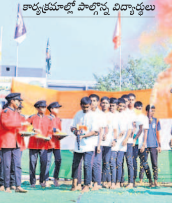
మహబూబాబాద్లో సాంస్కృతిక కార్యక్రమాల్లో పాల్గొన్న విద్యార్థులు