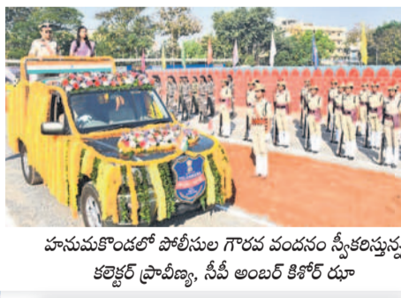
హనుమకొండలో పోలీసుల గౌరవ వందనం స్వీకరిస్తున్న కలెక్టర్ ప్రాబీణ్ణి, సీపీ అంబర్ కిశోర్ రూ