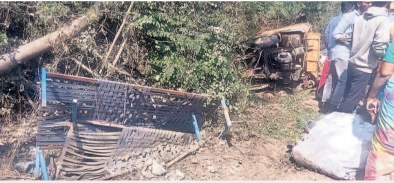
ఘటనా స్థలంలో సుజ్ఞనుజ్ఞయిన ఆటో, మంచాలు, ఇతర వస్తువులు

పరంగల్ వారసా: మృతుల కుటుంబాలను మంత్రి కొండా సురేఖ పరామర్శించారు. వర్షానికి ఎమ్మెల్యే కేశర్ నాగరాజు, కలెక్టర్ సత్యశారదాతో కలిసి ఎంజీఎం దవాఖాన మార్కురీకి చేరుకుని మృతదేహాలను పరిశీలించారు. కుటుంబాలను ఓదార్చి, ఆర్థిక సాయం అందజేశారు. క్షతగాత్రులను కలిసి డైర్యం చెప్పారు. క్షతగాత్రులు, మృతుల కుటుంబాలకు ప్రభుత్వం తరఫున అందాల్సిన సహాయాన్ని వెంటనే అందించాలని అధికారులను ఆదేశించారు.