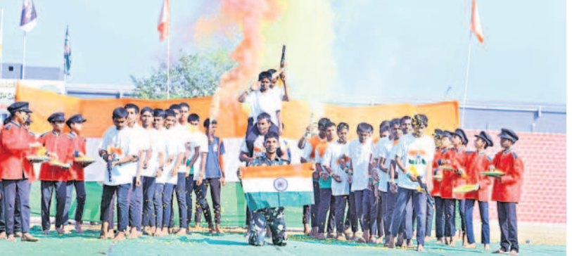
ముహూబాబాద్లో సాంస్కృతిక కార్యక్రమాల్లో పాల్గొన్న విద్యార్థులు