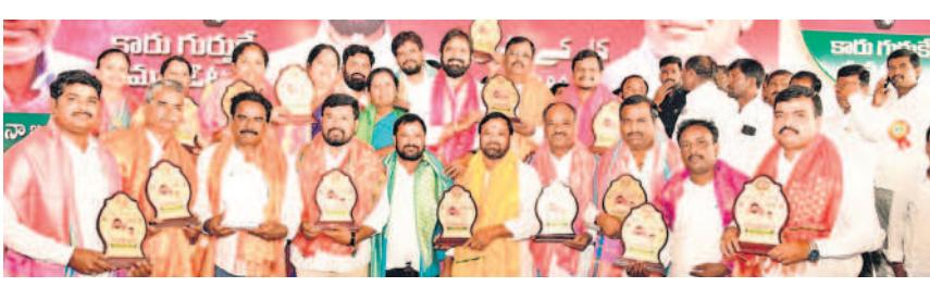
మహబూబ్ నగర్ లో కౌన్సిలర్లను సన్మానిస్తున్న మాజీ మంత్రి శ్రీనివాస్ గౌడ్