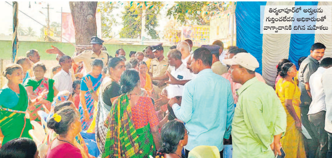
తిర్వలాపూర్ లో అర్చనను గుర్తించలేదని అధికారులతో వాగ్వాదానికి దిగిన మహిళలు