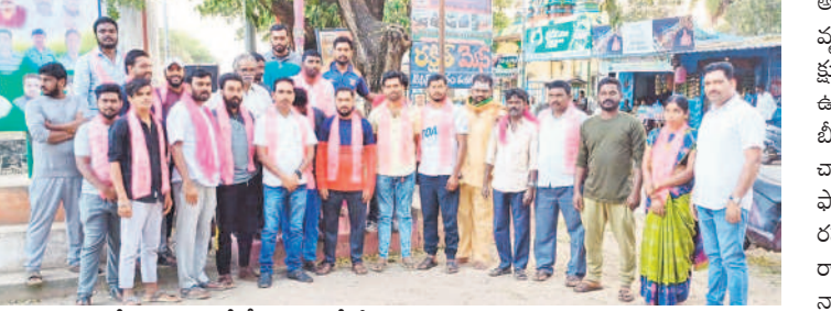
దోమలపెంటలో బీఆర్ఎస్ లో చేరిన కాంగ్రెస్ నాయకులు, కార్యకర్తలు