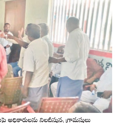
మిషన్ భగీరథ నీటి సరఫరా నిలిచి ఇబ్బందులు పడుతున్నామని, అధికారులకు చెప్పినా పట్టించుకోవడం లేదని ఆగ్రహం వ్యక్తం చేశారు.

మిషన్ భగీరథ నీటి సరఫరా నిలిచి ఇబ్బందులు పడుతున్నామని, అధికారులకు చెప్పినా పట్టించుకోవడం లేదని ఆగ్రహం వ్యక్తం చేశారు. ప్రభుత్వ ప్రాథమిక పాఠశాలకు ఒకే ఒక్క ఉపాధ్యాయుడితో విద్యాభ్యాసం కొనసాగుతుందని, విద్యార్థులు నష్టపోతున్నట్లు తెలిపారు. సమస్యలు చెప్పినా పట్టించుకోకపోతే అధికారులను నిలదీశారు. స్పందించిన ఎంపీడివో దుమ్మియ్యగౌడ్ నిడుల కొరక కారణంగా సమస్యలను పరిష్కరించలేకపోతున్నామని, వీలైనంత త్వరగా పరిష్కరించమని హామీ ఇవ్వడంతో గ్రామస్థులు శాంతించారు.