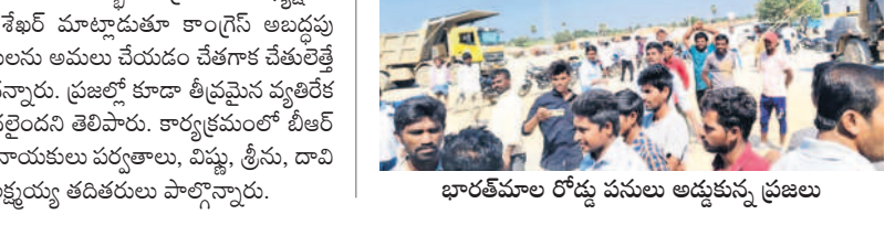
భారత్ మాల రోడ్డు పనులు అడ్డుకున్న ప్రజలు