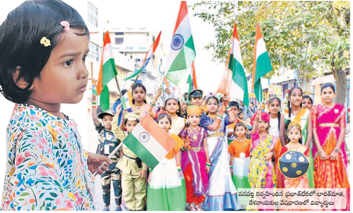
ఉమ్మడి జిల్లా వ్యాప్తంగా లక్షలకే వేడుకలు