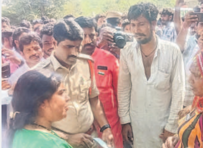
బాధిత కుటుంబ సభ్యులతో మాట్లాడుతున్న కలెక్టర్

పరంగల్ వారసా: మృతుల కుటుంబాలను మంత్రి కొండా సురేఖ పరామర్శించారు. వర్షానికి ఎమ్మెల్యే కేశర్ నాగరాజు, కలెక్టర్ సత్యశారదాజీ కలిసి ఎంజీఎం దవాఖాన మార్చురికి చేరుకుని మృతదేహాలను పరిశీలించారు. కుటుంబాలను ఓదార్చి, ఆర్థిక సాయం అందజేశారు. క్షతగాత్రులను కలిసి డైర్యం చెప్పారు. క్షతగాత్రులు, మృతుల కుటుంబాలకు ప్రభుత్వం తరఫున అందాల్సిన సహాయాన్ని వెంటనే అందించాలని అధికారులను ఆదేశించారు.