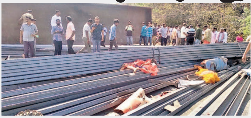
రోడ్డు ప్రమాదంలో లాల్ నుంచి రోడ్డుకు అడ్డంగా పడ్డ ఇనుప స్తంభాలు, వాటి మధ్యలో ఉన్న మృతదేహాలు