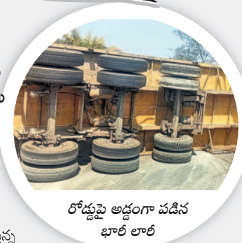
రోడ్డుపై అడ్డంగా పడిన భారీ లాల్

కరీమాబాద్, జనవరి 26 : వారంతా పాట్లకూటి కోసం ఎక్కడో సుదూర ప్రాంతం నుంచి ఇక్కడకు వచ్చి బతుకుతున్నారు. పనిచేసేందుకు మరో ప్రాంతానికి వెళ్తుండగా లాల్ డ్రైవర్ నిర్లక్ష్యం ఆ కుటుంబాన్ని చిబిమేసినది. కళ్ళ ముందే తమ కుటుంబ సభ్యుల మృతిని చూసి ఆ తల్లి గుండెలు పగిలేలా రోదించింది. ఇనుప స్తంభాల మధ్య ఉన్న తన భర్త, కూతుళ్ళను చూసి కన్నీరుమున్నుగా విలపించింది. కొనసాగింపులో ఉన్న కొడుకును తన ఒడిలో పెట్టుకొని ఆపన్న హస్తం కోసం ఎదురుచూసింది. తలలు పగిలి.. ఎముకలు విరిగి మృతదేహాలు చిద్రమయ్యాయి. ఈ ఘటనను చూసిన వారి హృదయాలు చలిచిపోయాయి. లాల్