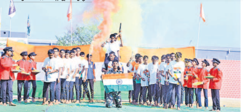
మహబూబాబాద్లో సాంస్కృతిక కార్యక్రమాల్లో పాల్గొన్న విద్యార్థులు