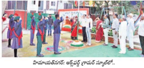
హిమాయత్ నగర్ : అక్బర్ గ్రామ సూల్లో..