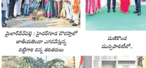
మైలారదేవపల్లి : హైదర్ గూడ వారసాలో జాతీయజెండా ఎగురవేస్తున్న బిడ్డెగారి బిన్న తదితరులు