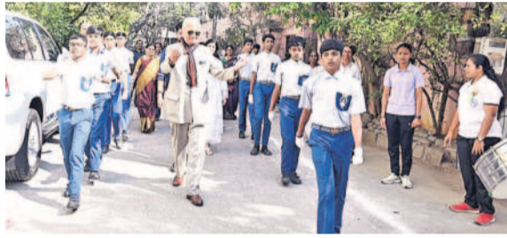
వెంగళరావునగర్ : నలద సూల్లో గణతంత్ర వేడుకలకు విచ్చేస్తున్న భారత రాయబారి బిస్కాప్ వోర్రా