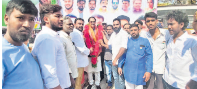
ఎర్రతాబాద్ : బోరబండలో గణతంత్ర వేడుకల్లో పాల్గొన్న జూబ్లీహిల్స్ ఎమ్మెల్యే మాగుంటి గోపీనాథ్