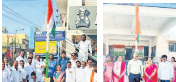
మైలారదేవపల్లి : హైదర్ గూడ వారసాలో జాతీయజెండా ఎగురవేస్తున్న బిడ్డెగారి బిన్న తదితరులు