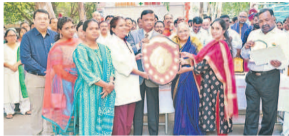
ఖైరతాబాద్ : నిమ్మ దవాఖానలో ఉత్తమ సేవలందించిన సిబ్బందికి షీట్లు, ప్రశంసాపత్రాలను అందజేస్తున్న డైరెక్టర్ నగం బీరమ్