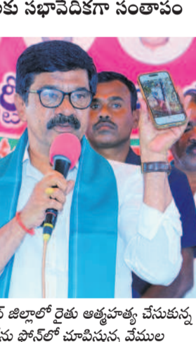
ఆదిలాబాద్ జిల్లాలో రైతు ఆత్మహత్య చేసుకున్న ఫోటోను ఫోన్లో చూపిస్తున్న వేముల

మోరార్జీ, జనవరి 25: బుస్సాపూర్ లో రైతు ముఖా ముఖి కార్యక్రమం జరుగు తున్న సమయంలోనే ఆదిలా బాద్ జిల్లా బజార్ హత్యార్ మండలంలో రైతు మామిళ్ళ సర్కారుకు ఉద్యోగుల అత్త పాత్రులు చేసుకున్నాడని ఇప్పుడే తెలిసిందని ఫోన్ లో వచ్చిన మెస్సేజ్ మాజీ మంత్రి వేముల మాఫీ చేశారు. అధ్యయన కమిటీ రైతుల బాధలు తెలుసుకుని వారిలో ధైర్యాన్ని నింపేందుకు తిరుగుతున్న ఈ సమయం లోనే మరో రైతు నేలవారిందని ఆవేదన వ్యక్తం చేశారు. ఈ దురాగ్రమైన ప్రభుత్వం చేతకానివరకు వల్ల కష్టపాలింది. ఆత్మహత్య వైఖరి వల్ల కేసీఆర్ ఏం చేస్తే అది తీసే త్వలు చేసుకున్న రైతుల ఆత్మకూ శాంతి చేకూరాలని రెండు నిమిషాలు మాసం పాటింపాలని కోరడంతో కార్యక్రమానికి హాజరైన రైతులు, అధ్యయన కమిటీ సభ్యులు లేచి మాసం పాటించారు.