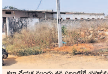
కబ్బా చేయడం ముందు తన స్థలంలోనే ప్రాథమిక నిర్మాణాలు చేసుకున్న రియల్ ఎస్టేట్ వ్యాపారి

ఆదిబట్ల, జనవరి 23 : ఆదిబట్లలో భూముల రేట్లు కొట్టకు పడగెత్తడంతో కొంతమంది కబ్బారాయుళ్లు ఖాళీ స్థలం కనబడితే పలు కబ్బా చేస్తున్నారు. ఆదిబట్ల మున్సిపాలిటీ పరిధిలో 20.11లో గల ఇందిరమ్మనగర్ కాలనీలో కొంతమంది కబ్బారాయుళ్లు రిచ్చిపోతున్నారు. కాలనీవాసుల అవసరాల నిమిత్తం 150 గజాల స్థలాన్ని కేటాయించారు. గతంలో ఆ స్థలంలో తాగు నీటి ట్యాంకులను ఏర్పాటు చేసి కాలనీవాసులకు అందించారు. ప్రభుత్వం ఆ కాలనీకి కృషి చేసి సరఫరా చేయడంతో ట్యాంకులు నిరుపయోగమయ్యాయి. దీంతో గతంలో కొంతమంది కన్ను ఆ స్థలంపై