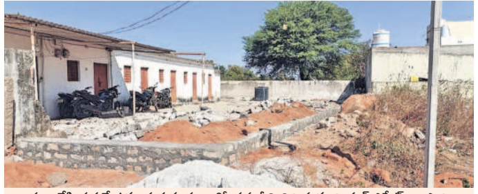
కబ్బా చేసి పక్కనే ఉన్న ప్రభుత్వ స్థలంలో ప్రాథమిక నిర్మాణాలు చేసుకున్న రియల్ ఎస్టేట్ వ్యాపారి

పడింది. ఆ స్థలంలో ఉన్న వాటర్ ట్యాంకులను కూల్చివేసి ఆ స్థలాన్ని కబ్బా చేయడానికి ప్రయత్నించారు. దీంతో అప్పటి మున్సిపల్ కమిషనర్ కబ్బాదారులపై పోలీసులకు ఫిర్యాదు చేసి నిర్బంధించారు. నేడు కొంతమంది అధికారి పార్టీ బలంతో మరో మారు కబ్బాకు తెర తెవారని కాలనీవాసులు ఆరోపిస్తున్నారు. వెంటనే కబ్బాదారులపై చర్యలు తీసుకుని ప్రభుత్వ స్థలాన్ని కాపాడాలని డిమాండ్ చేస్తున్నారు. రిపోజిట్ కలిపేటకు ఫిర్యాదు చేస్తామని స్పష్టం చేశారు.