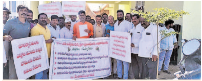
ఎన్నికల ముందు ఇబ్రహీం హామీలు అమలు చేయాలంటూ డిమాండ్ చేస్తున్న భూ నిర్వాసితులు

ఇబ్రహీంపట్నం రూరల్, జనవరి 23 : ఇబ్రహీంపట్నం రూరల్ కాంగ్రెస్ ప్రభుత్వం రైతు భరోసా, ఇందిరమ్మ ఆత్మయ భరోసా, రేషన్ కార్డులతో పాటు పలు రకాల పథకాలపై నిర్వహిస్తున్న గ్రామసభలు మండలవ్యాప్తంగా