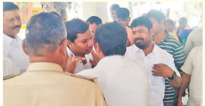
నల్లవెల్లిలో అధికారులను నిలదీస్తూ గ్రామస్థులు

ఆదీనంలోకి తీసుకున్నారు. అయినప్పటికీ గ్రామసభను అడ్డుకుంటారన్న సమాచారం రావడంతో ఉదయం నుంచే పలువురు రైతులను హాస్ ఆరెస్టు చేశారు. ఇలాంటి పట్టుకుండులలోని ఎలిమినేషన్ గ్రామంలో ఇటీవల ప్రభుత్వం పలు కంపెనీల కోసం భూసేకరణ జరిపింది. భూసేకరణ సందర్భంగా తమకు పరిహారాన్ని పెంచుతామని, అలాగే, భూములు కోల్పోయిన వారందరికీ ఇండ్లన్నీ లాభిస్తామని ఎన్నికల ముందు కాంగ్రెస్ పార్టీ నాయకులు హామీ ఇచ్చారు. హామీలను నెర