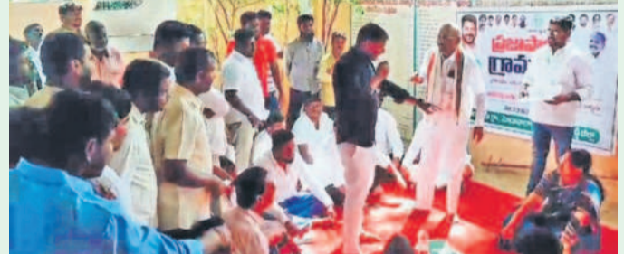
చిలుకూరులో కాంగ్రెస్ నేత సభలో మాట్లాడుతుండగా అతడిపై తిరగబడ్డ జనం

మొయినాబాద్ : మండల పరిధిలోని చిలుకూరు గ్రామంలో గ్రామ సభ రహితంగా మారింది. రైతులు వ్యవసాయం చేస్తున్న భూములను నాన్ అగ్రికల్చరల్ గ్రామం చేయడంతో రైతులు వ్యవసాయ అధికారులను నిలదీశారు. క్షేత్రస్థాయిలో పర్యటింపకుండా ఓ వ్యవసాయం క్షేత్రంలో కూర్చుని వేర్వేరు చేసి రైతులకు రైతు భరోసా కట్ చేసే కుట్రలు చేస్తారా అని అధికారులపై రైతులు తీవ్ర స్థాయిలో మండిపడ్డారు. అంతలోనే ఏమైనా సమస్యలుంటే చెప్పాలని ఓ కాంగ్రెస్ నేతల నేత మాట్లాడుతుండగా.. సందేహాలను నివృత్తి చేయాలింది అధికారులారా.. కాంగ్రెస్ నేతనా అని ఆగ్రహం వ్యక్తం చేశారు. కొంతసేపు సభా రహితంగా మారింది. గ్రామ సభ రాజకీయ రంగు పులు ముక్కోవడంతో అధికారులు కలలు పట్టుకునే లను నివృత్తి చేయాలింది అధికారులారా.. కాంగ్రెస్ నేతనా అని ఆగ్రహం వ్యక్తం చేశారు.