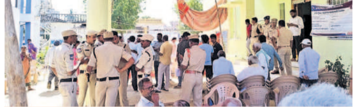
ఇబ్రహీంపట్నం రూరల్ : ఎలిమినేషన్ గ్రామసభలో ప్రజల కంటే పోలీసుల బలగాల ఎక్కువ..