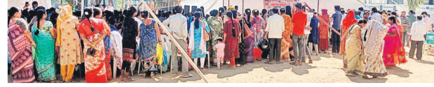
అవస్థలు పదుతున్న ఉపాధ్యాయులు, విద్యార్థులు

బండ్లగూడ, జనవరి 23 : గ్రామ సభల విద్యార్థులకు అధికారుల నిర్లక్ష్యం జోరుగా కనిపిస్తున్నది. గ్రామ సభలు ఏమీ గాని విద్యార్థులకు అలభ్యంగా మారింది. రాష్ట్ర ప్రభుత్వం ఆదేశాలతో మరోసారి కబ్బా చేసి ప్రజారాని నిర్బంధించారు. నేడు కొంతమంది అధికారి పార్టీ బలంతో మరో మారు కబ్బాకు తెర తెవారని కాలనీవాసులు ఆరోపిస్తున్నారు. వెంటనే కబ్బాదారులపై చర్యలు తీసుకుని ప్రభుత్వ స్థలాన్ని కాపాడాలని డిమాండ్ చేస్తున్నారు. రిపోజిట్ కలిపేటకు ఫిర్యాదు చేస్తామని స్పష్టం చేశారు.