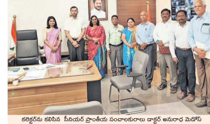
కలెక్టరును కలిసిన సీనియర్ ప్రాంతీయ సంచాలకులూ డాక్టర్ అనురాధ మెదోస్

భారత ప్రభుత్వ కుటుంబ సంక్షేమ శాఖ సీనియర్ ప్రాంతీయ సంచాలకులూ డాక్టర్ అనురాధ మెదోస్