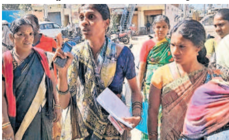
చేగుంట మండలకేంద్రంలో ఏర్పాటు చేసిన గ్రామ సభలో తమ పేర్లు రాలేదని ఆందోళన చేస్తున్న మహిళ