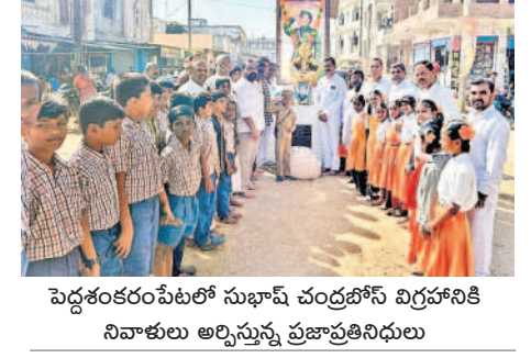
పెద్దశంకరంపేటలో సుభాష్ చంద్రబోస్ విగ్రహానికి నివాళులు అర్పిస్తున్న ప్రజాసభిదారులు