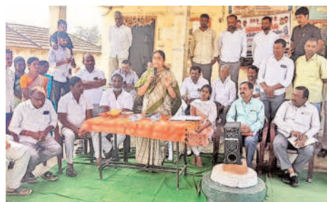
కౌడిపల్లి: నాగ్ నాన్ పల్లి ప్రజాపాలన గ్రామసభలో మాట్లాడుతున్న నర్సాపూర్ ఎమ్మెల్యే సునీ తార్కాలెంరెడ్డి