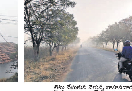
లైట్లు వేసుకుని వెళ్తున్న వాహనదారులు