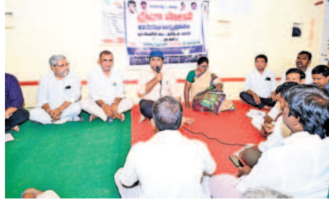
రేగోడ్: సింధోల్ గ్రామసభలో ప్రభుత్వ పథకాల గురించి ప్రజలకు వివరిస్తున్న కలెక్టర్ రాజులక్ష్మి