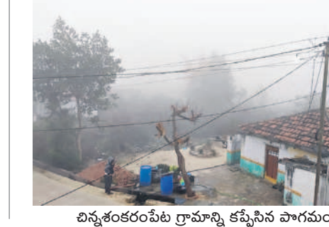
చిన్నశంకరంపేట గ్రామాన్ని కమ్మేసిన పొగమంచు

వస్తున్న వాహనాలు కనబడలేదు. ఉదయం 8 గంటలకు కూడా పొగమంచు కమ్మడయం తో వాహనదారులు లైట్లు వేసుకొని వెళ్ళాల్సిన పరిస్థితి ఏర్పడింది.