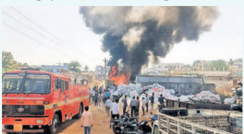
మంటలను అదుపు చేస్తున్న ఫైర్ సిబ్బంది