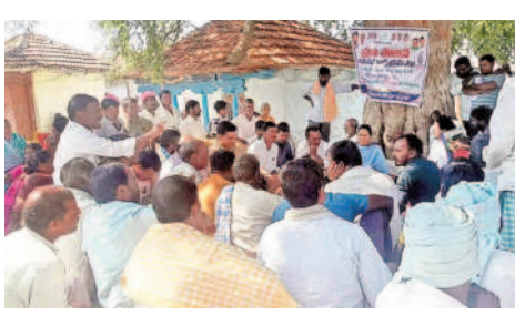
కొల్లూరం: మండలపూర్తి గ్రామసభలో ఇందిరమ్మ భరోసా పథకంపై లభికారులను ప్రశ్నిస్తున్న డి.వ్యక్తి