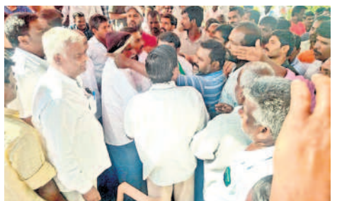
వెల్లూర్: మాసాయిపేట మండలంలో పరస్రం ఆరోహణలు చేసుకుంటూ వాగ్దానానికి దిగిన ఆయా పార్టీల నాయకులు