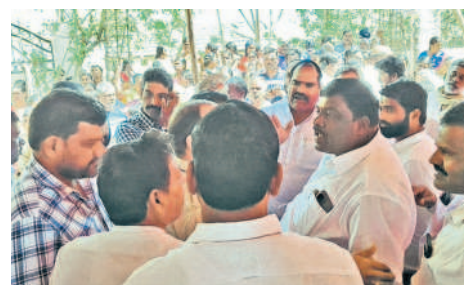
శివ్వంపేట: గోమారంలో నిర్వహించిన గ్రామసభలో వాగ్దానం చేసుకుంటున్న ఆయా పార్టీల నాయకులు