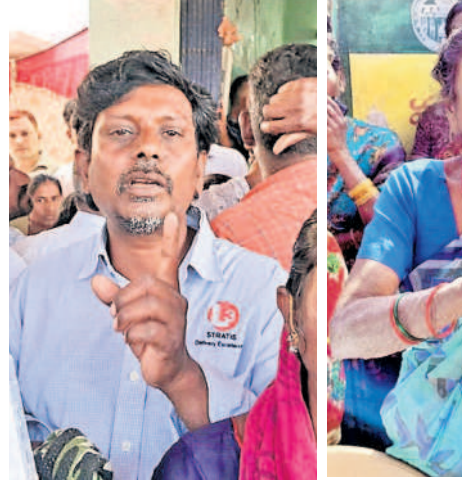
చేగుంట, వెల్లూర్లో పథకాల్లో తమ పేర్లెక్కడ ఉన్నాయని ప్రశ్నిస్తున్న ప్రజలు

కౌడిపల్లి, జనవరి 23: మోసపూరితమైన మాటలు పక్కకు పెట్టి ప్రజల సమక్షంలోనే నిర్ణయం తీసుకుని అర్హులకు న్యాయం చేయాలని నర్సాపూర్ ఎమ్మెల్యే సునీ తార్కాలెంరెడ్డి అన్నారు. గురువారం మండలంలోని నాగ్ నాన్ పల్లిలో గ్రామసభ నిర్వహించారు.