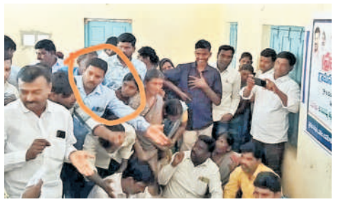
బేక్కల్ మండల కేంద్రంలో నిర్వహించిన గ్రామసభలో ప్రజలను బెదిరిస్తున్న కాంగ్రెస్ కార్యకర్త