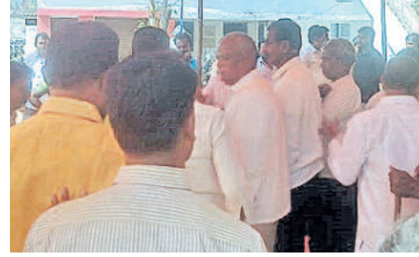
తూప్రాన్: ఇన్చార్జిలో నిర్వహించిన గ్రామ సభలో లభికారులతో వాగ్దానానికి దిగుతున్న గ్రామస్థులు