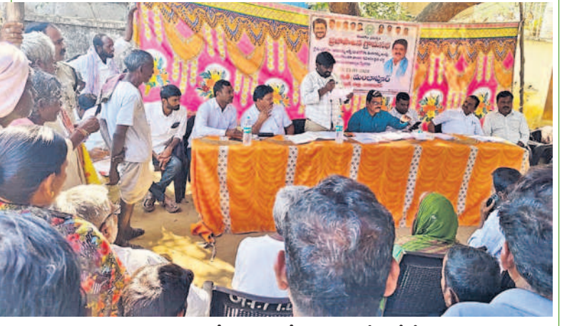
మంబూపూర్ లో గ్రామసభ కోసం ఏర్పాటు చేసిన స్టేజీపై అధికారులతో కలిసి కూర్చున్న కాంగ్రెస్ పార్టీ నాయకులు