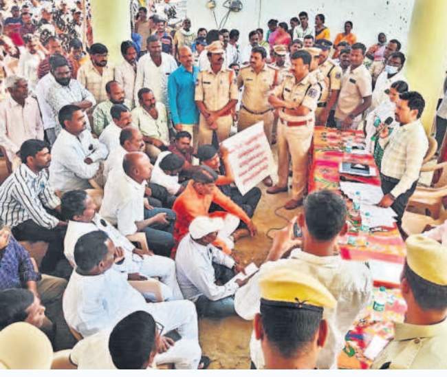
ఇబ్రహీంపట్నం రూరల్ : ఎలిమినేషన్ గ్రామసభను అడ్డుకుంటున్న స్థానికులు, రైతులు