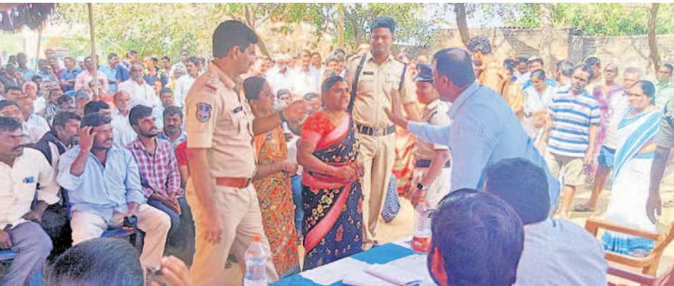
నర్సంపేట : ఇటుకలపల్లి గ్రామ సభలో పథకాలపై నిలదీస్తున్న మహిళలను సముదాయిస్తున్న అధికారి