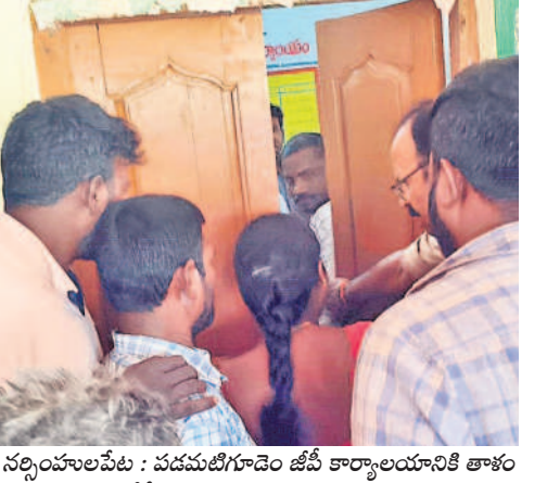
నర్సింహలపేట : పడమటిగూడెం జీవీ కార్యాలయానికి తాళం వేసేందుకు ప్రయత్నిస్తున్న మహిళ

రఘునాథపల్లి : కోడూరులో అధికారులను నిలదీస్తున్న యువకుడు దాయపర్తి : కొలనుపల్లిలో అధికారులను నిలదీస్తున్న దుర్గయ్యను బయటకు నెట్టివేస్తున్న కానిస్టేబుల్