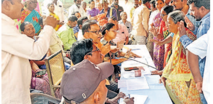
పాలకుర్తి : దళితంలో అధికారులతో వాగ్వాదం చేస్తున్న మహిళలు, గ్రామస్థులు