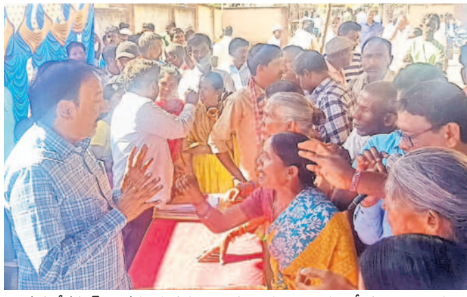
మహావేదం: అనర్ధలకు పథకాలు ఇస్తున్నారని అధికారులతో ప్రజల వాగ్వాదం