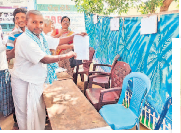
బిస్నెసువారు : ఖాళీ కుర్చీలకు దరఖాస్తు ఇస్తున్న గ్రామస్థులు