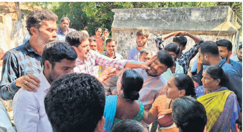
జనగామ జిల్లా వడ్డకొండలో జరిగిన గ్రామసభలో పథకాలకు అనుకూలమైన ఎంపిక చేయడంపై పేదల తరఫున ప్రశ్నించినందుకు ఓ యువకుడిపై దాడిచేస్తున్న కాంగ్రెస్ నాయకులు

PUBLISHED FROM HYDERABAD • KARIMNAGAR • WARANGAL • KHAMMAM • NALGONDA • MAHABUBNAGAR • NIZAMABAD www.ntnews.com 00/ntdailyonline