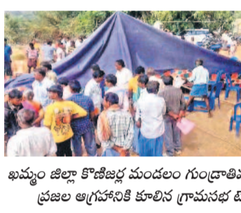
ఖమ్మం జిల్లా కొణిజెర్ల మండలం గుండ్రాతిమడుగులో ప్రజల ఆగ్రహానికి కూరిన గ్రామసభ టెంట్

హైదరాబాద్, జనవరి 22 (నమస్తే తెలంగాణ) : బూటకపు హామీలపై అధికారంలోకి వచ్చాక మొండివెయ్యి చూపిన కాంగ్రెస్ ప్రజల్లో ఆగ్రహం వెల్లువెత్తుతూనే ఉన్నది. రాష్ట్రవ్యాప్తంగా బుద్ధవారం సైతం గ్రామసభలు రణరంగంగా మారాయి. పలుచోట్ల ఆగ్రహం పట్టలేక కాంగ్రెస్ నాయకులను ప్రజలు కొట్టేదాకా వచ్చింది. ఆయా గ్రామాల్లో ఎదురైన ప్రశ్నలకు సమాధానాలు చెప్పలేక అధికారులు, పజాప్రతినిధులు తలలు పట్టుకున్నారు. పలుచోట్ల నర్సే సరిగా లేదని, అవకతవకలు జరిగాయని > 2వ పేజీలో