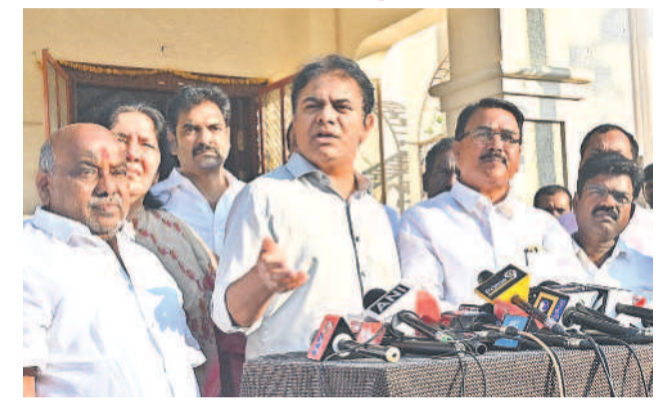
బుద్ధవారం రైతు అధ్యయన కమిటీ తొలి సమావేశం తర్వాత ప్రెస్ కన్ఫరెన్స్ నిరంజన్ రెడ్డి, సభ్యులతో కలిసి మీడియాతో మాట్లాడుతున్న బీఆర్ఎస్ ప్రసిడెంట్ కేటీఆర్

అన్నదాత క్షేమం కోసమే అధ్యయన కమిటీ: కేటీఆర్