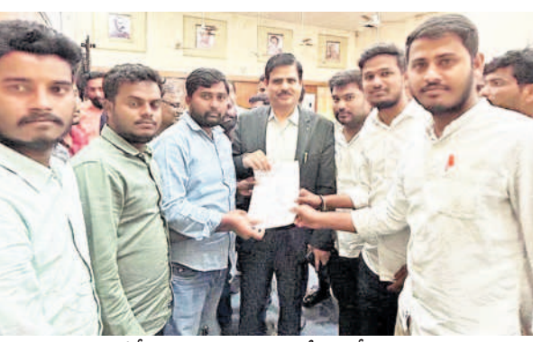
ఓయూ వీసీకి వినతిపత్రం ఇస్తున్న బీఆర్ఎస్వీ నాయకులు

జాబితాలో రీసెర్స్ పేపర్స్ ప్రజెంటేషన్, సెమినార్, పబ్లికేష న్స్ కు వెయిటేజ్ ఇవ్వాలి ఎంట్రన్స్ క్వాలిఫై అయిన అందర్నీ ఇంటర్వ్యూకి పిలవాలని విజ్ఞప్తి చేశారు. ఎంట్రన్స్ క్వారిఫై అర్హతను ఓసీలకు 40శాతం, బీసీ లకు35శాతం ఎస్సీ, ఎస్టీ