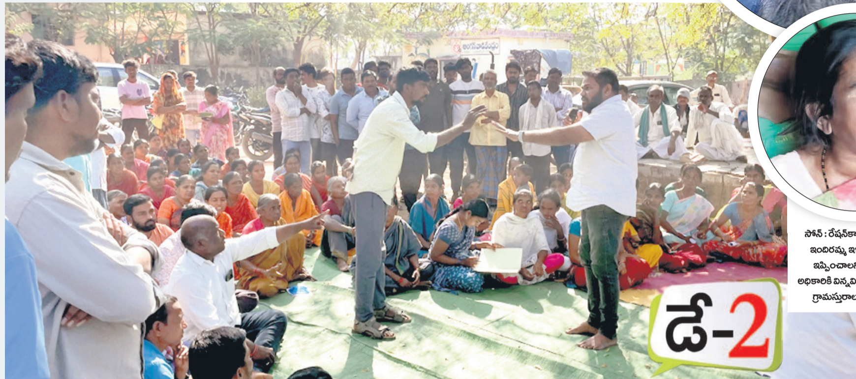
దిలావర్పూర్ మండలంలోని బస్సుపెట్టి గ్రామ సభలో రేషన్ కార్డుల జాబితాను చదివి వినిపిస్తుండగా అర్జులకు రేషన్ కార్డులు రాలేవని రెవెన్యూ అధికారులను నిలదీస్తున్న యువకులు