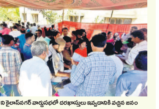
పట్టణంలోని కైలాసంగనగర్ వార్డు సభల్లో దరఖాస్తులు ఇవ్వడానికి వచ్చిన జనం

టున్న వారికి ఎలాంటి రసీదులు ఇవ్వకపోవడం లేదు. దీంతో తాము దరఖాస్తు ఇచ్చినట్లు నిరూపించుకుంటే మరే ఏమీ తెలియజేయాలని అధికారులు కోరుతున్నారు. జనం జాబితాలో తమ పేర్లు లేకపోవడంతో ఆందోళన చెందుతున్నారు. అసలు విషయం పట్టణంలోనే ఉందని తెలుసుకుంటే మరే ఏమీ తెలియజేయాలని అధికారులు కోరుతున్నారు. అసలు విషయం పట్టణంలోనే ఉందని తెలుసుకుంటే మరే ఏమీ తెలియజేయాలని అధికారులు కోరుతున్నారు. అసలు విషయం పట్టణంలోనే ఉందని తెలుసుకుంటే మరే ఏమీ తెలియజేయాలని అధికారులు కోరుతున్నారు. అభిదారుల ఎంపికలో సందిగ్ధత అభిదారుల ఎంపికలో భాగంగా అర్జుల జాబితాను వార్డు, గ్రామసభల్లో ప్రదర్శిస్తున్నారు. ఏమైనా అభ్యంతరాలు ఉంటే తెలియజేయాలని అధికారులు కోరుతున్నారు. అసలు విషయం పట్టణంలోనే ఉందని తెలుసుకుంటే మరే ఏమీ తెలియజేయాలని అధికారులు కోరుతున్నారు. అసలు విషయం పట్టణంలోనే ఉందని తెలుసుకుంటే మరే ఏమీ తెలియజేయాలని అధికారులు కోరుతున్నారు.