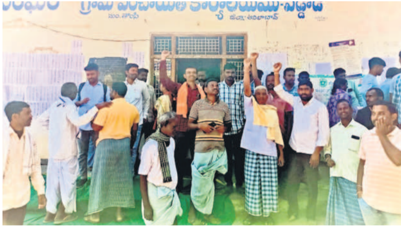
తాంసి : గ్రామసభను బహిష్కరించి నిరసన తెలుపుతున్న వడ్డాడి గ్రామస్థులు

ప్రభుత్వ పథకాలకు అభిదారుల ఎంపిక కోసం నిర్వహిస్తున్న గ్రామసభలు రెండో రోజైన బుధవారం యుద్ధ భూములను తలపించాయి. అభిదారుల ఎంపికలో లోటుపాట్లు ఉన్నాయంటూ.. అర్జుల పేర్లు జాబితాలో లేవంటూ జనం తిరగబడ్డారు. అర్జుల పేర్లు లేకుండా అధికార పార్టీ చెప్పినట్లు వీధి వ్యాజాలలు నిద్దం చేశారా? అంటూ ప్రశ్నించారు. ఉమ్మడి ఆదిలాబాద్ జిల్లా వ్యాప్తంగా వలు గ్రామ, వార్డు సభల్లో రెండో రోజైన బుధవారం నిరసనలు, నిలదీతలు, ఆందోళనలు కొనసాగాయి.