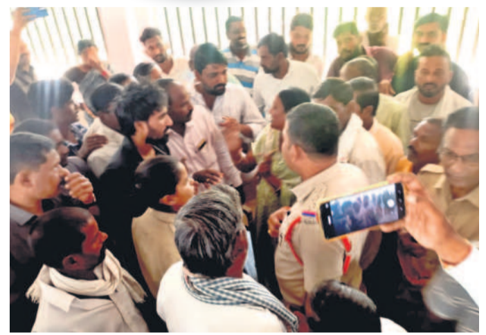
కలవరమగు : సుంకిడిలో అధికారులతో వాగ్వివాదానికి దిగిన బీఆర్ఎస్ నాయకులు