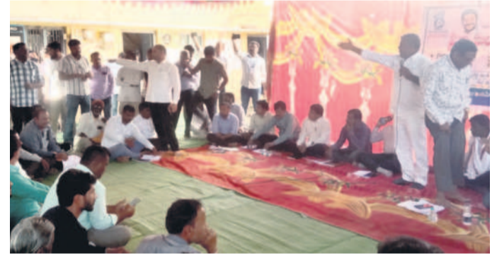
ఇంద్రవెల్లి : వాగ్వివాదానికి దిగిన కాంగ్రెస్ పార్టీ, బీఆర్ఎస్ పార్టీ నాయకులు