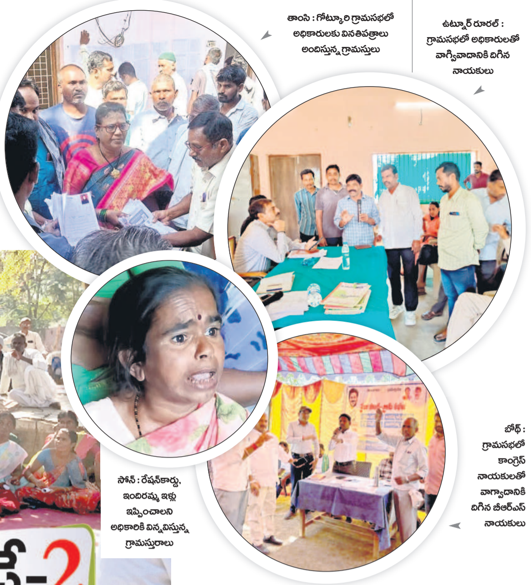
తాంసి : గోటూర్ గ్రామసభలో అధికారులకు వివరణలు అందిస్తున్న గ్రామస్థులు ఉమ్మడి రూరల్ : గ్రామసభల్లో అధికారులతో వాగ్వివాదానికి దిగిన నాయకులు