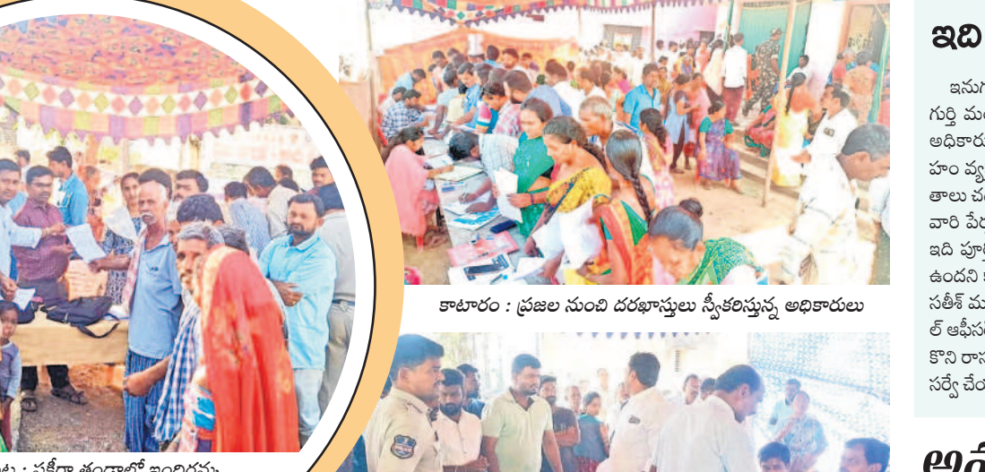
నర్సంపేట : ఫకీరా తండాలో ఇందిరమ్మ ఇండ్ల సర్వే మళ్ళీ చేపట్టాలని వినవేత్రం ఇస్తున్న గ్రామస్థులు