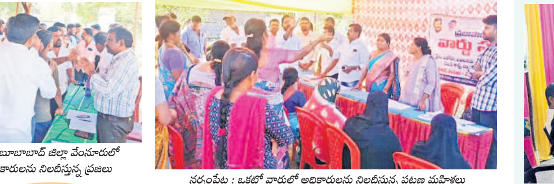
నర్సంపేట : ఒకటో వార్డులో అధికారులను నిలదీస్తున్న పట్టణ మహిళలు