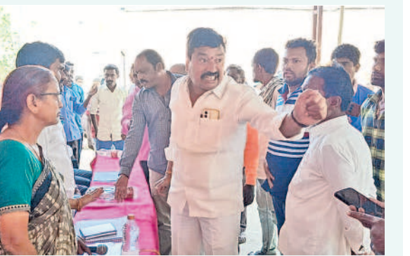
కోమటిపల్లి గ్రామసభలో సిబ్బందిపై ఆగ్రహం వ్యక్తం చేస్తున్న కూర్చి నటీక