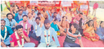
హనుమకొండలో దీక్షలలో పాల్గొన్న ఆర్థిక ఉద్యోగులు