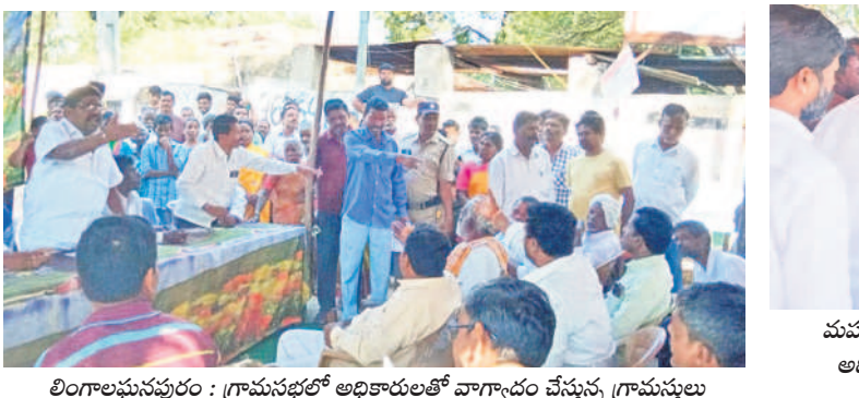
లింగాలపేటపూర్ : గ్రామసభలో అధికారులతో వాగ్వాదం చేస్తున్న గ్రామస్థులు

అందాకేసేలతా రోషారెత్తిన ఉమ్మడి జిల్లా ఏలైలు