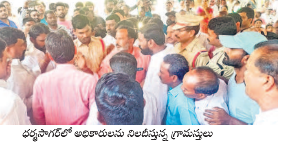
ధర్మసాగర్లో అధికారులను నిలదీస్తున్న గ్రామస్థులు