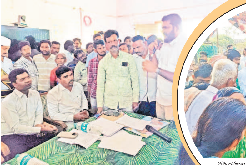
కాటారంలో అధికారులతో వాగ్వాదానికి దిగిన ప్రజలు, నాయకులు