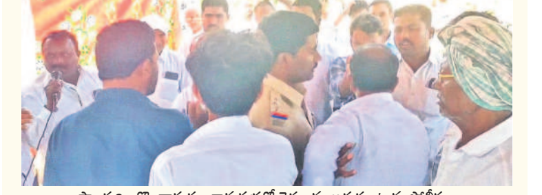
పాలకుర్తి : కొండాపూర్ గ్రామసభలో రైతులను అడ్డుకుంటున్న పోలీసులు