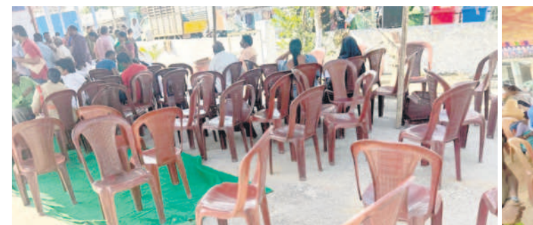
యైటింక్లయిన కాలనీ : 17వ డివిజన్లో ఖాళీగా ఉన్న కుర్చీలు

ఫర్మలైజేషన్, జనవరి 21: ఎల్లూపల్లి, గుంటూరుపల్లి, ఎస్సీగోల్లో సభలు నిర్వహించారు. ఏ పథకానికి దరఖాస్తు చేసుకోవాలన్నా తెల్లకాగితంపై రాసి ఇమ్మాలని అధికారులు కేవలం అభ్యంతరం వ్యక్తం చేశారు. ప్రభుత్వం కేవలం రాబోయే స్థానిక సంస్థల ఎన్నికలను దృష్టిలో పెట్టుకుని ప్రజలను మళ్లీ పెట్టడానికి ప్రజాపాలన సభలు నిర్వహిస్తున్నదని విమర్శించారు.