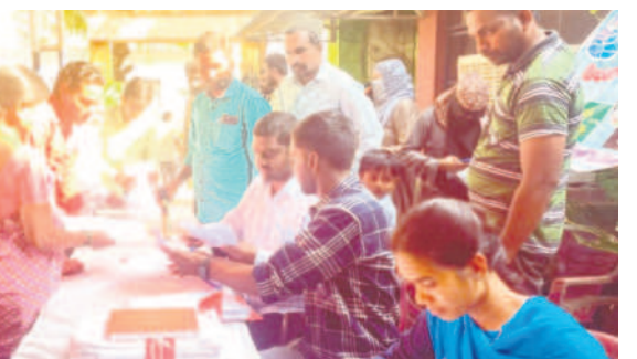
పెద్దపల్లి : దరఖాస్తులు ఇస్తున్న ప్రజలు