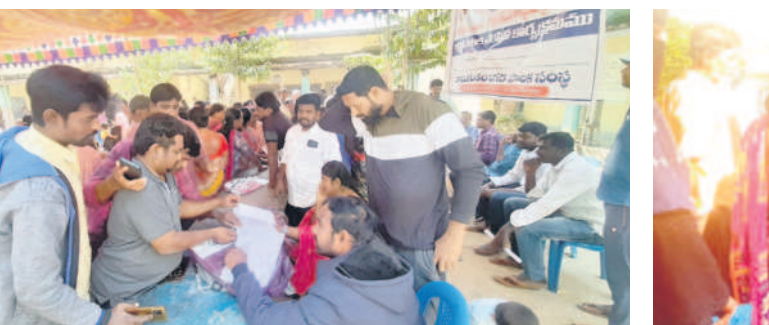
జ్యోతిస్ గర్ (రామగుండం): విలేజ్ రామగుండం సభలో ప్రజలు