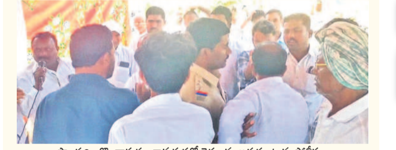
పాలకర్తి : కొండాపురం గ్రామసభలో రైతులను అడ్డుకుంటున్న పోలీసులు