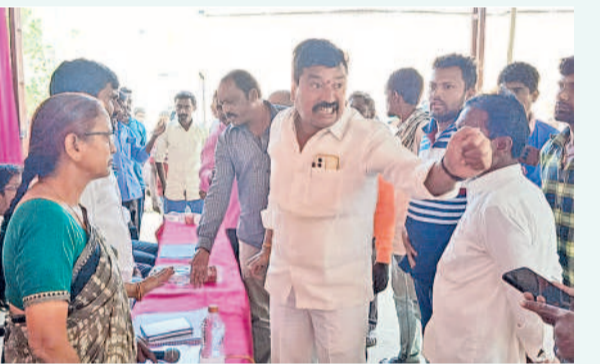
కోమటిపల్లి గ్రామసభలో సిబ్బందిపై ఆగ్రహం వ్యక్తం చేస్తున్న కూర్చి నటికే