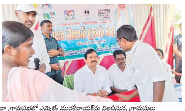
సోమనాథం గ్రామసభలో ఎమ్మెల్యే మురళీనాయక్ ను నిలదీస్తున్న గ్రామస్థులు