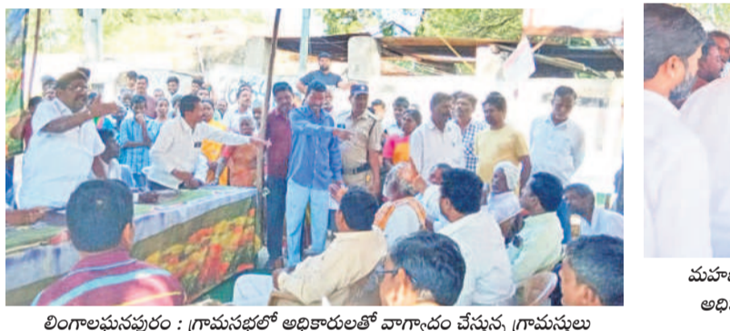
లింగాలపంపురం : గ్రామసభలో అధికారులతో వాగ్వాదం చేస్తున్న గ్రామస్థులు