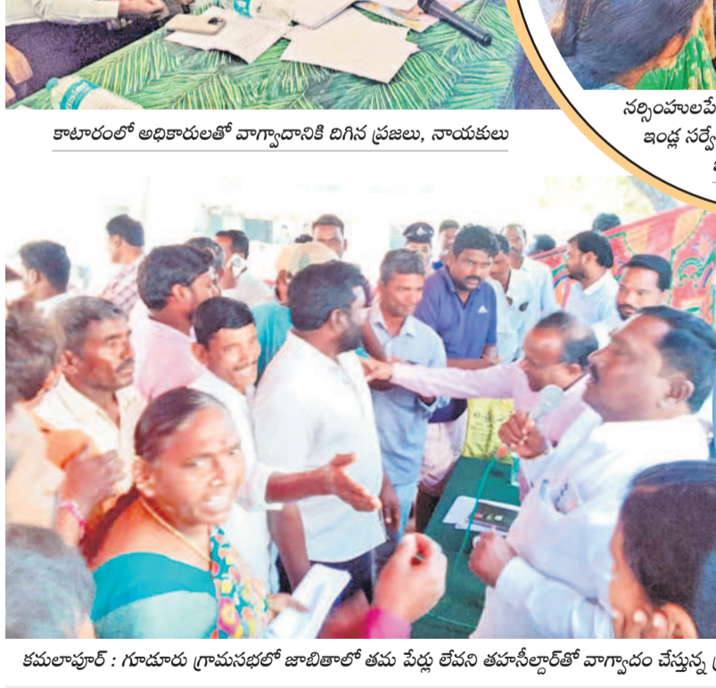
కమలాపురం : గూడూరు గ్రామసభలో జాబితాలో తమ పేర్లు లేవని తహసీల్దార్ తో వాగ్వాదం చేస్తున్న గ్రామస్థులు