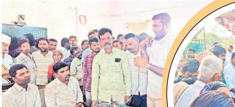
కాటారంలో అధికారులతో వాగ్వాదానికి దిగిన ప్రజలు, నాయకులు

అందాకేసినంతా హోరెత్తిన ఉమ్మడి జిల్లా ఏలైలు